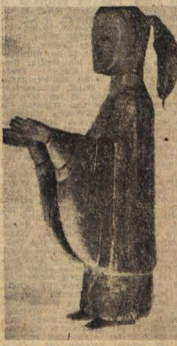
Med 800 najdenimi predmeti je tudi tale leseni kipec

Na bambusnih deščicah so našli znanstveniki kakih 1700 pisemk, ki pa jih vseh niso mogli razvozlati. Stene sarkofaga so polne podob, izdelanih v živih barvah. Te slike ponazarjajo takratni način življenja v tej kitajski pokrajini, po vseh najdenih predmetih pa lahko strokovnjaki zdaj določene sklepe o kulturi, umetnosti in sploh ustvarjalni dejavnosti davnih prebivalcev pokrajine Henan.