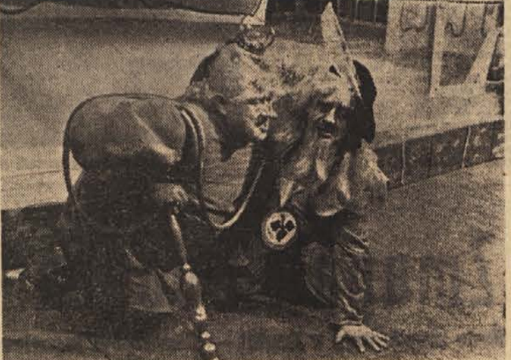
Prizor iz opere Sergeja Prokofjeva »Zaljubljen v tri oranže«, s katero se je naša Opera ponovno afirmirala v tujini

nega dela je med drugim zapisal o uprizoritvi: »Originalna izvedba umetniškega ansambela Opere SNG iz Ljubljane je ena izmed tistih, kakršno dosežejo v nasprotju z našimi gledališči stalni ansambli...«