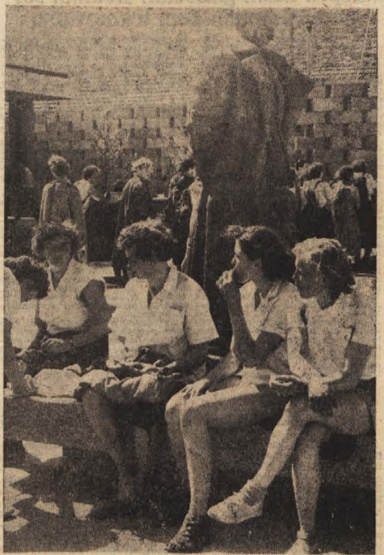
Počitek po pohodu na ploščadi Gospodarskega razstavišča

Prireditev je uspela v vsem - tako kar zadeva množičnost kot izreden propagandni in moralni uspeh. To je bil najlepši spomin na osvobodilno fronto in narodnoosvobodilno vojno sploh.