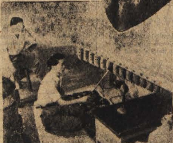
Trinajst zvoncev raznih velikosti so preizkusili v znanstveno-raziskovalnem inštitutu za narodno glasbo. Zvonci dajejo različne tone, vsi pa imajo izredno čiste glasove