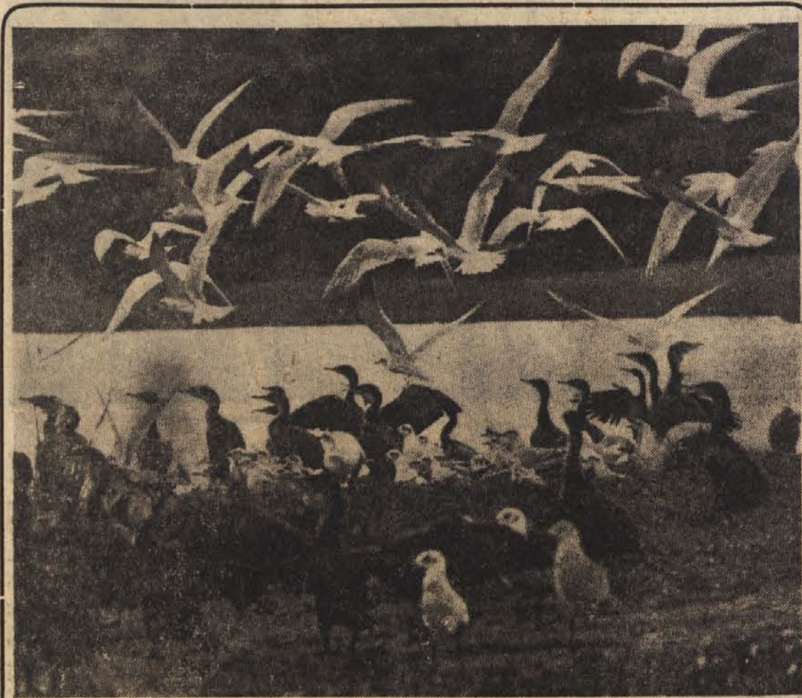
Afriški svet ob zemeljskem ravniku je zaradi toplega podnebja in obilne vlage pravi raj za številne vodne in druge ptice. Na močvirnih področjih so včasih pravcati oblaki pisanih močvirskih in drugih ptic. Na sliki: Kolonija kormoranov in rdečokih galeb. Prvi se hranijo z ribami, drugi pa s povodnjaj žuželkami