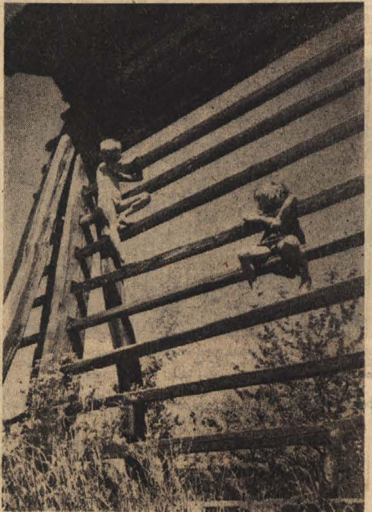
Zelena vigred je z opojnim vonjem prvih cvetov zavpela prek travnikov in polj. Star kozolec sredi cvetočega travnika je postal najljubše zatočišče mladih prijateljev

Zagreb, 12. maja (Tanjug). — Predsednik republike Josip Broz Tito se je včeraj na poti v Beograd ustavil v Raši. S člani rudarskega delavskega sveta in člani puljskega OLO Pulja se je združil v krajšem razgovoru. Ob odhodu je predsednika Tita navdušeno pozdravilo veliko število delavcev in članov njihovih družin, ki so se zbrali v Raši pred Domom rudarjev.