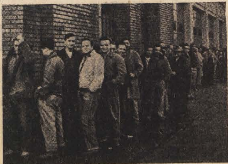
Vrste brezposelnih pred uradom za delo v Detroitu

Na Zahodu oživlja prizadevanje, da bi znova iz temeljev proučili politiko nasproti Arabcem. Ameriško zunanje ministrstvo na primer izraža željo, da bi normaliziralo stike s Kairo in Damaskom, posamezni ameriški časniki pa se zavzemajo za tesnejše stike z neodvisnimi deželami v Afriki in Aziji nasploh. V zvezi z bolj realnimi stiki z ZAR navaja »New York Times« tudi spoznanje o oškodovanih delničarjih bivše Šueške družbe in poudarja, da bo s tem »odstranjena največja ovira na poti k obnovi normalnih stikov med ZAR in zahodnim svetom.«