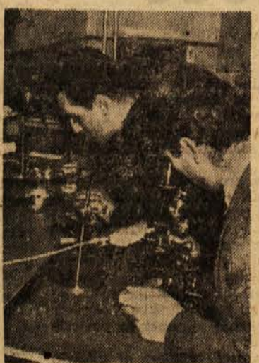
Pred »zdravljenjem« je treba predmete temeljito pregledati in ugotoviti vse poškodbe

Zadnja steklena vrata, ki peljejo z dvorišnega hodnika v zakladnico slovenske preteklosti, so v poznih dopoldanskih urah zaklenjena. Siva mogočna stavba z velikimi okni, ki so skoraj