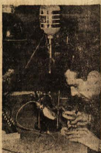
Z milimetrskim električnim svetrom odstranjuje konservator pod povečevalnim steklom ranico dragocenega predmeta

potrebno še marsikaj. Ko homo sedanjih laboratorij dovolj razširil, bomo lahko še uspešneje delali. Takrat arheoloških predmetov ne bomo samo reševali, temveč jih bomo tudi proučevali. Tako bomo spoznali marsikaj, kar sedaj še ne poznamo.