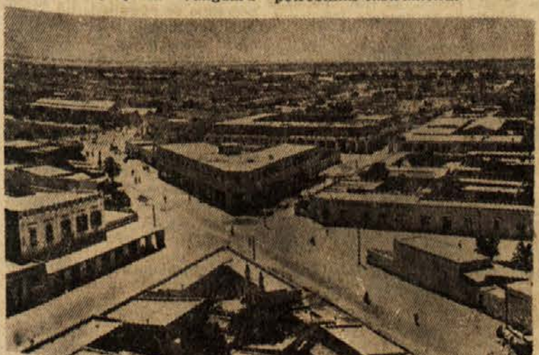
Pogled na Kartum

Novi satelit tehta poldrugi kilogram in meri v premeru kakih 16,50 cm. Z daljnogledom ga ne bo moč videti razen v izredno ugodnih pogojih. Okrog Zemlje kroži tudi zadnji del rakete "Vanguard", ki ga bo morda laže opaziti. Ta ima obliko valja s premerom kakih 50 cm. Skupaj s tem delom rakete je tehtal satelit kakih 22 kg. Hagen je izjavil, da bodo ZDA zdaj poskusile izstreliti večji satelit za znanstvene raziskave, opremljen s vsemi potrebnimi instrumenti.