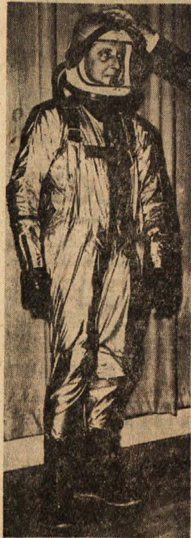
Scott Crossfield je izdelal letalsko obleko, kakršno naj bi nosili piloti, ki bodo prvi poleteli na mesec. Na sliki: poskusni pilot, ki je prvi letel z dvojno zvočno hitrostjo. Nova obleka bo po konstruktorjevih besedah varovala ljudi vsepovsod v vesolju

Po poročilih iz Vatikana je papež uradno proglasil sveto Klaro za zaščitnico televizije. Temu sporočilu so dodali tudi kratek življenjepis svetnice, ki je pred smrtjo slišala nekakšne zборе, kar spravljajo v zvezo s televizijo.