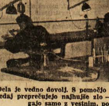
Dela je vedno dovolj. S pomočjo modernih tehničnih sredstev sedaj preprečujejo najhujše zlo - korozijo, ki jo lahko premagajo samo z vestnim, požrtvovalnim delom

Različni okraski, ki so nekaj stoletij počivali nekaj metrov pod zemljo in jih je arheologova lopata spet dvignila na svetlo, so mnogokrat precej poškodovani, vendar so še vedno ohranili svojo nekdanjo lepoto.