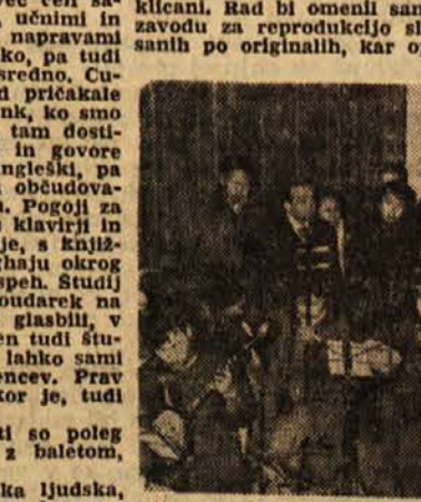
Solski orkester kitajskih ljudskih instrumentov v Nankingu

večidel slabotni, zlasti moški, ki so po večini visoki, celo infantilni. Čudoviti so kostumi, nad vse pa je odlična mimika, bogata izraznost rok in obvladanje telesa nasploh, saj je skoraj vsak pevec tudi odlični pesalec. Scena je zdaj simbolično nakazana, zdaj realistična, pa orientalsko barvita. Značilni so krajši prizori pred - notranjo - zavoso med daljšimi dejanji v vsej globini odra.