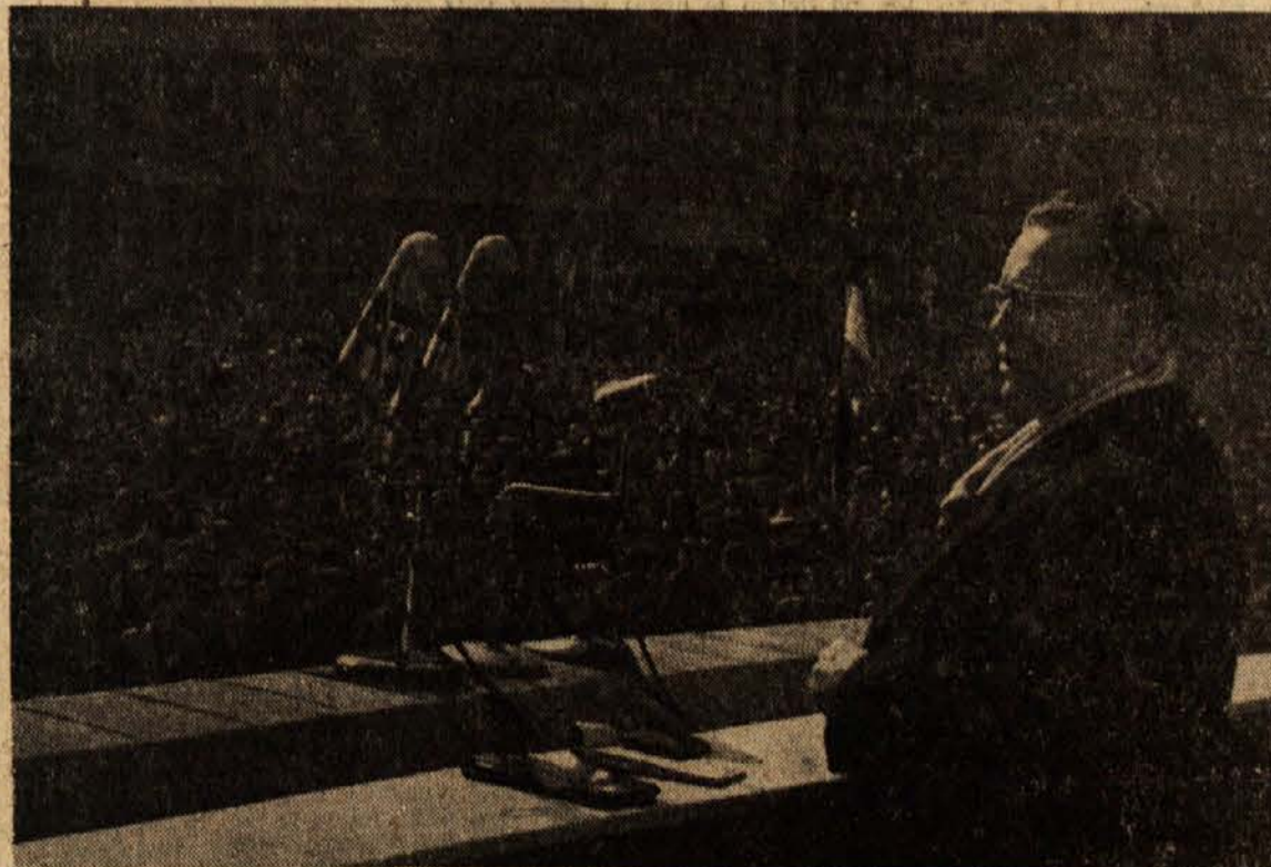
Predsednik Tito je minulo nedeljo govoril na velikem predvolilnem zborovanju v Beogradu, ki se ga je udeležilo blizu 300.000 ljudi