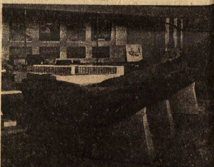
Praški narodni muzej je pripravil razstavo predmetov iz 10. in 11. stoletja. Posnetek kaže izdoleni čoln, ki so ga našli v naplavinah Vitave. Pravijo, da je star vsaj 800 let. Ker je bil rečni mulj vrstna naravna konzerva, je čoln še kar dobro ohranjen