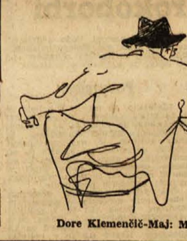
Dore Klemenčič-Maj: Motiv iz kavarne Le Dôme

Morda eden najlepših zalivov na svetu je zaliv med pristanikom mestom Haifongom in Hongajem. Sredi globokega, modrega morja se dvigajo otoki, skalnate glave, na stotine in stotine, kamor nese oko. Oblike so tako raznolike in fantastične, da se jih človek ne more nagledati. Bilzu Hongaja je rudnik odličnega antracita, ki ga dobivajo kar v dnevnem gom. Separacija je moderno urejena in docela mehanizirana.