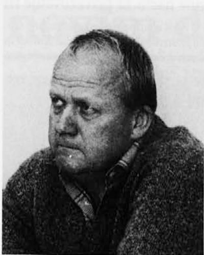
v Julijcih. To delo je bilo tudi oddolžitve moji ožji domovini.

Največ mi, mislim, pomeni prva knjiga, ki je izšla leta 1965 z naslovom »Pot v planine«, ker je bil to začetek moje literarne (z malo začetnico) poti in mojega upodabljanja doživetij v gorah, ki so mi najbolj pri srcu,