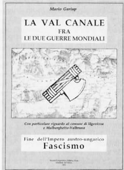
Naslovnica najnovejše Garjupove knjige

Večer je bil lep in prijeten, poleg tega pa je imel še poseben pomen: bil je namreč še ena postaja na poti iskanja skupnega in prijateljskega sosodstva vseh jezikovnih skupnosti, ki danes bogatijo to dolino pod sv. Višarjami.