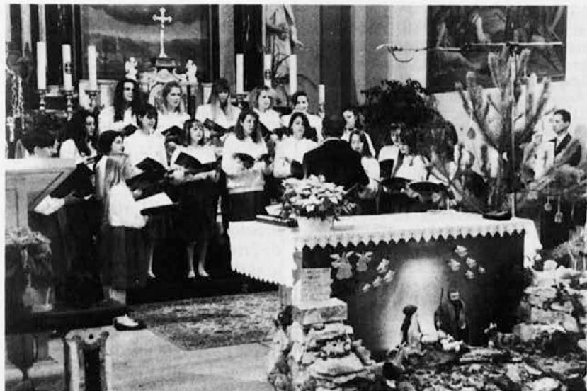
Tudi letos so se po naših cerkvah zvrstili tradicionalni božični koncerti. O nekaterih poročamo v tej številki Novega lista. Posnetek D. Križmančiča je z Opčin.

časopisju. Kolikor je stranka informirana, je prišlo do sedanjega paritetnega in enakopravnega vplivanja obeh krovnih organizacij na podlagi sporazuma med obema ob prizadevanju vloge subjekta manjšinski skupnosti. Povsem negativno pa je vpletanje tako občutljive problematike v strankarsko pogojene predsodke in boje proti političnim skupinam, ki so ostale zveste Demosovemu programu demokratizacije.