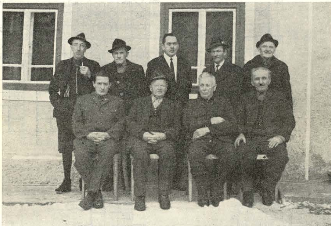
Upokojujenci GO Ravne so se ponovno srečali

Med temi urami niso bili videti kot upokojujenci, ampak šegavi gozdarji — »holcerji«, ki so v svoji delovni dobi doživeli marsikaj. Veliko se je od takrat spremenilo. Staro orodje je zamenjalo novo, drugačno, metode dela in zaščita pri delu so druge.