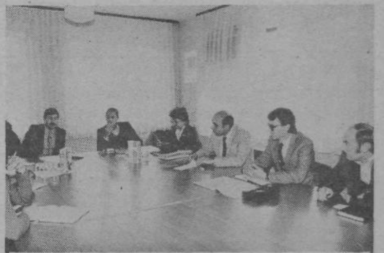
Prejšnji teden je bila na delovnem obisku pri OK ZKS Ljubljana Moste-Polje delegacija OK ZK Srbije iz Gornjega Milanovca. V pogovoru na komiteju, v Rogovem tozdu Dvokolesa in v Kolinski se je seznanila s političnimi razmerami in naporu, s katerimi v naši občini uresničujemo stabilizacijski program.

Medtem tudi že gradijo krajevno kablensko omrežje, ki bo pokrilo celotno območje ATC Polje. Gradnja je razdeljena na več faz in bodo z njo nadaljevali še v prihodnjem letu, tako da bodo v prvi polovici leta 1984 telefone dobili vsi prosilci, ki živijo na območju ATC Polje. Tako bodo predvidoma pokrite vse potrebe po telefonskih priključkih na tem območju.