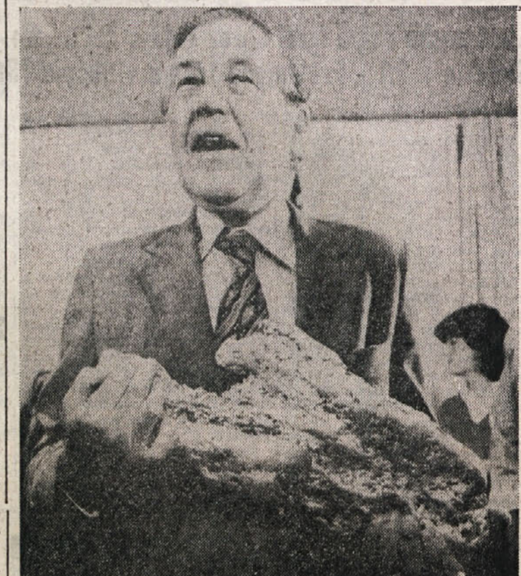
V severozahodni Victorii, v Avstraliji so našli 27,2 kg težko zlato zrno, ki so ga na dražbi prodali za milijon dolarjev