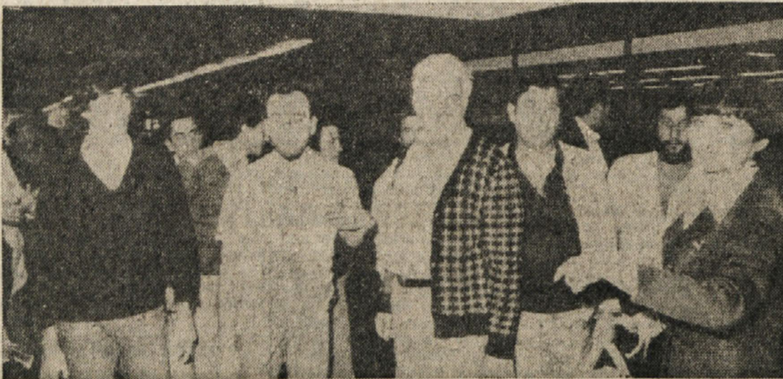
Štirindeset italijanskih pomorščakov motorne ladje «Capriolo», ki jih je vojna vihra zajela v iranskem pristanišču Koramsar, se je večer vrnilo z letalom v domače pristanišče Genova