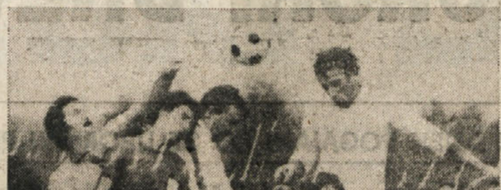
V 2. amaterski nogometni ligi na Trzaskem so v nedeljo odigrali prvi slovenski derbi. V Bazovici sta se namreč srečali med seboj enajsterici domače Zanje in Krasa, zastopnika zgoniske in repenbarske občine. Vzdunje na tekmi je bila tipično derbijska, tak pa je bil tudi končni izid, saj se je srečanje zaključilo brez zmagovalca, pri izidu 1:1.

Italijana Barazzutti in Panatta sta se na mednarodnem teniškem turnirju v Barceloni uvrstila v 2. kolo. Prvi je premagal Kolumbijca Francanca s 6:2 in 6:0, drugi pa Francoza Govena s 6:2 in 6:2. Nastopil je tudi Jugoslovanci. Franulović je s predstavilju odpravil Španca Gimenezca s 7:5 in 6:4.