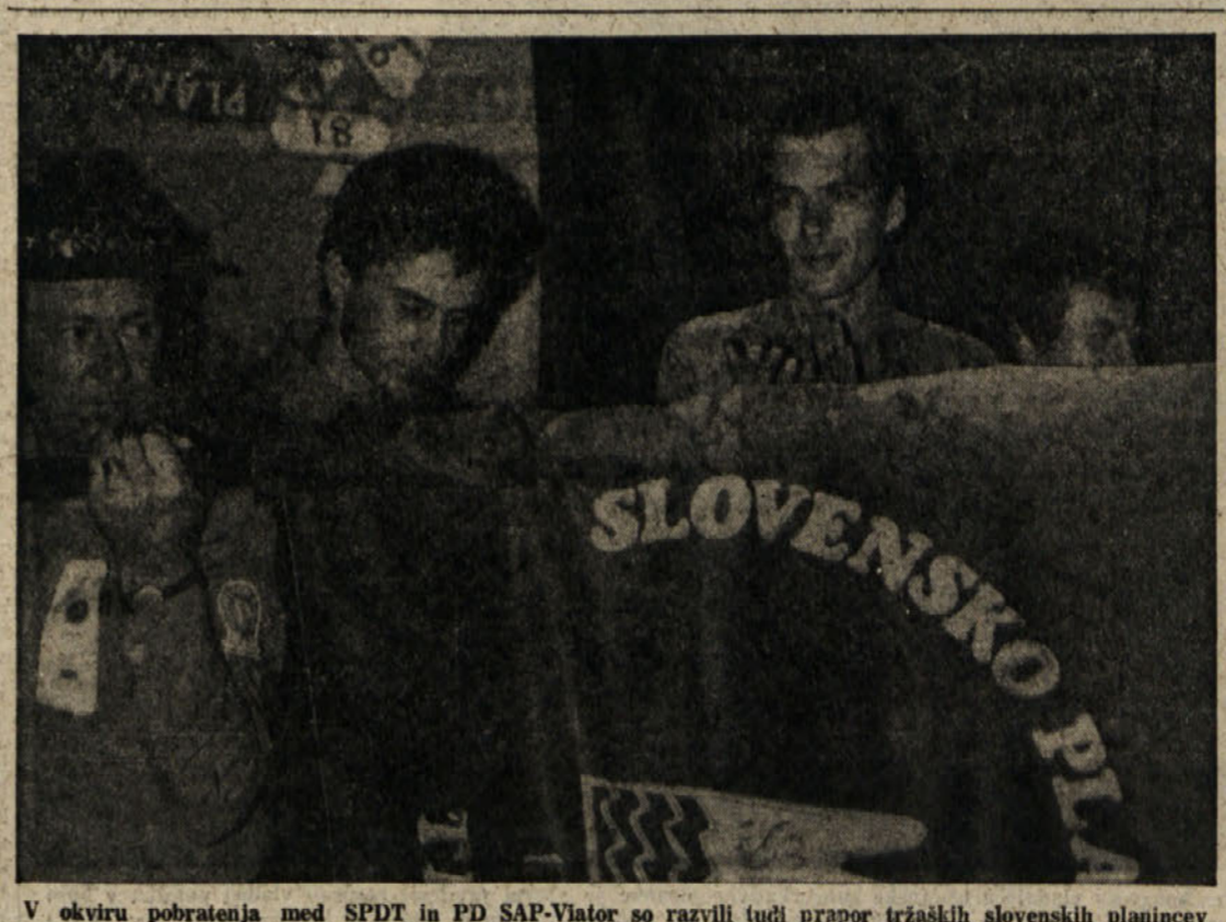
V okviru pobratenja med SPD in PD SAP-Viator so razvili tudi prapor tržaških slovenskih planincev