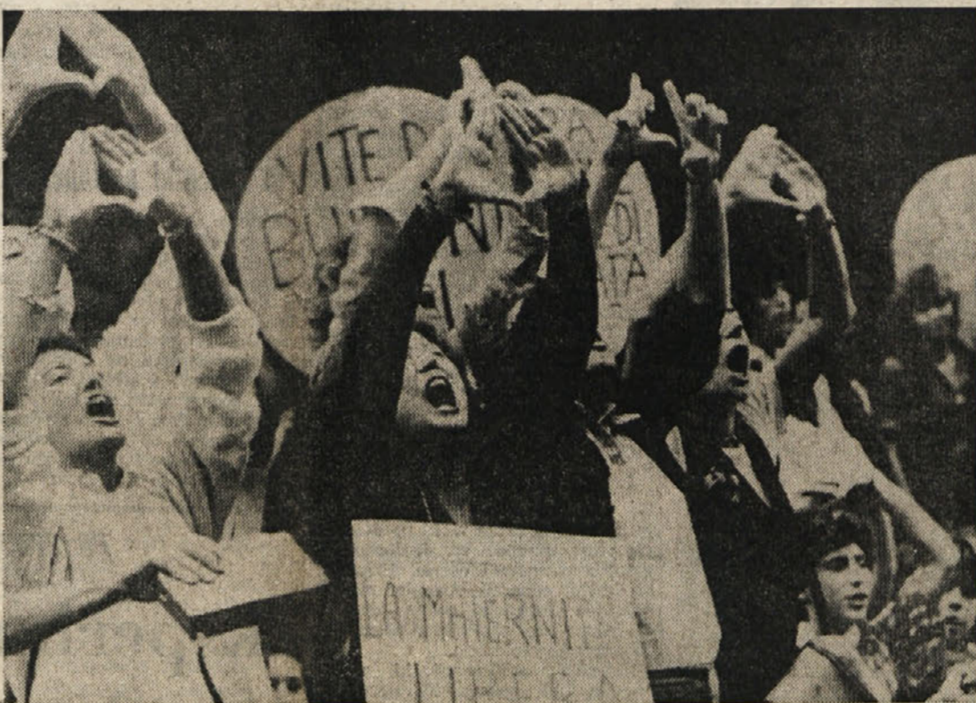
Protest žensk proti zbiranju podpisov za referendum o ukinitvi splava