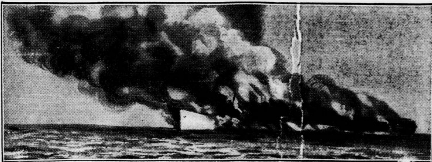
Slika, ki so jo po Belinovem sistemu poslali najprej v Rim, iz Rima v London in iz Londona v Pariz.