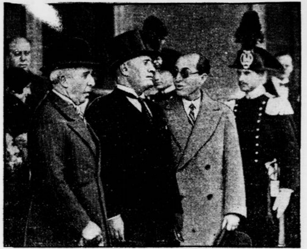
Po obisku turških državnikov v Moskvi sta odpotovala turški ministrski predsednik Izmet paša (na levi) in zunanji minister Rudži bej (na desni) v Rim, kjer ju je sprejel Mussolini. Z njim sta se razgovarjala o bodoči politiki v vzhodnem delu Sredozemskega morja.