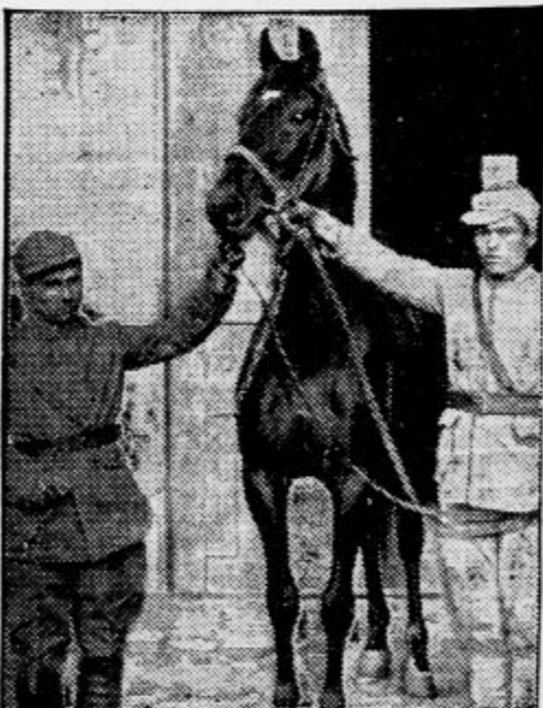
Moskovska vlada je poklonila turškemu diktatorju Kemalu plemenitega žrebca, ki ga vodita dva vojaka k svojemu novemu gospodarju.