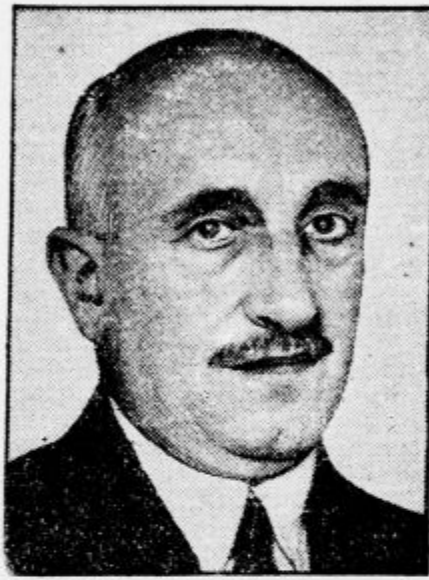
Ministrski predsednik Papanastasiou, voditelj opozicije proti venizelistom in privržencem diktature.