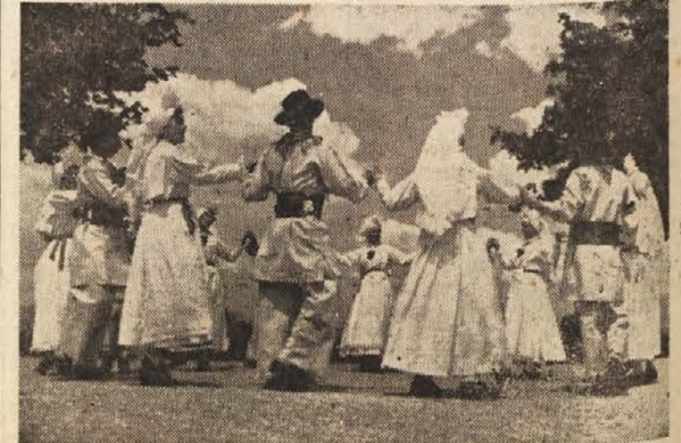
Belokranjska folklorna skupina (iz filma »Pomlad v Beli krajini«)

res ni mnogo! Toda dalje! Kmet-pijač, sestavljena ob zaključku šolskega leta na šolskih ustanovah črnomeljskega okraja, nam je dala nekaj zanimivih, hkrati pa poraznih ugotovitev. Oglemo si jih! Naše osnovne šole in gimnazije obiskuje 3200 učencev. Izmed teh ne uživa alkoholnih pi-