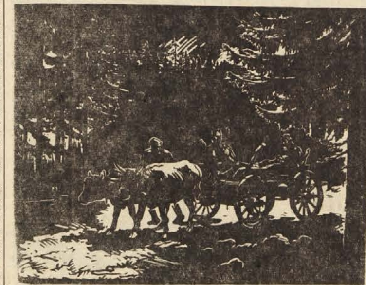
Branko Sotra: Prevoz ranjencev

Govoreč nadalje o Četrtri ofenzivi, je tovariš Tito nadaljeval: