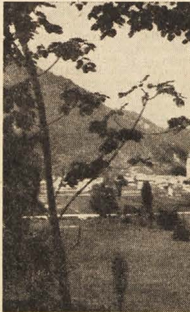
Pogled na Kobarid

oktobra se je začela nemška ofenziva pri Sv. Kvirinu. Se težji so bili napadi na severnem področju, od koder so Nemci pritiskali proti Stolu. 18. soška brigada jih je razgnala pri Žagi. Nemcem ni bilo žal žrtve in niso štedili svojih vojakov pri nadaljnjih napadih. Z močnimi si-