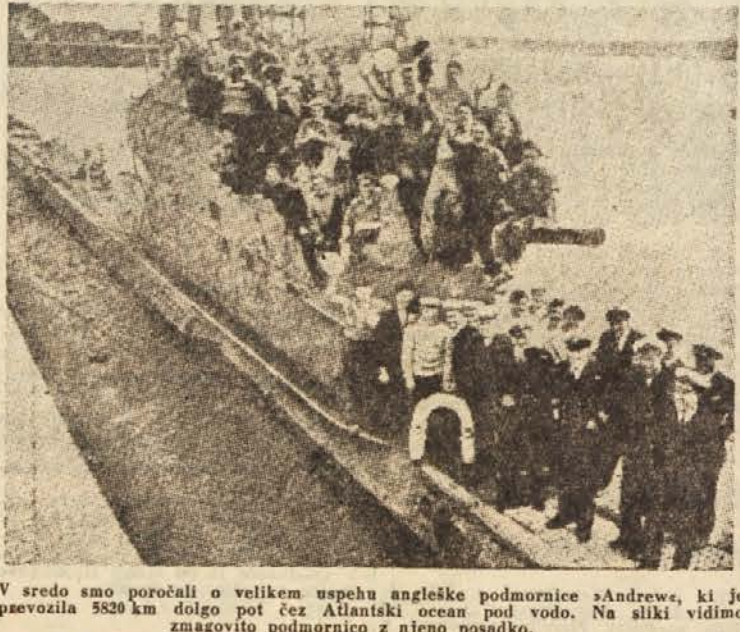
V sredo smo poročali o velikem uspehu angleške podmornice »Andrew«, ki je prevozila 5820 km dolgo pot čez Atlantski ocean pod vodo. Na sliki vidimo zmagovito podmornico z njeno posadko.

Mnogi narodi so poznali uporabo preprostega lesnega pluga za obdelovanje zemlje, čeprav so bili na zelo nizki stopnji. Edini narod, ki pluga ni poznal, je bil v srednjem delu Amerike živeči Majja. Zanimivo je, da je imel ta narod slikovno abecedo, da je poznal številke in ničilo ter njihovo uporabo, da je dosegel znatne uspehe v astronomiji in da je imel zelo razvito arhitekturo. Koruzo pa je sejnal v jamice, ki so jih delali v zemljo. Zato so svoja zemljišča često zapuščali in šli iskat novo rodovitno zemljo. S tako primitivnim obdelovanjem so zemljo kmalu izčrpali in ker je niso znali prerati, jim ni več rodila.