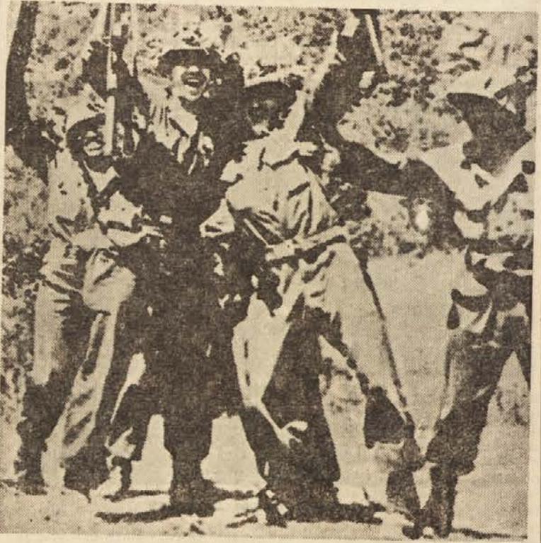
Vojski na Koreji so se doslej že nekajkrat veselili ob vesti, da bo kmalu podpisano premirje...

Poveljnik oboroženih sil Združenih narodov general Marc Clark je izdelal načrt za rešitev problema, ki je nastal zaradi zahtev južnokorejskega predsednika Sing Man Rija, naj se ne bi indijske čete in druge enote, določene za nadzorstvo nad ujetniki, izkrcale v Južni Koreji. Iz poučenih virov se je zvedelo, da je Clark predlagal, naj bi te enote prišle v stik z vojnimi ujetniki šele po podpisu premirja. Tako bodo lahko