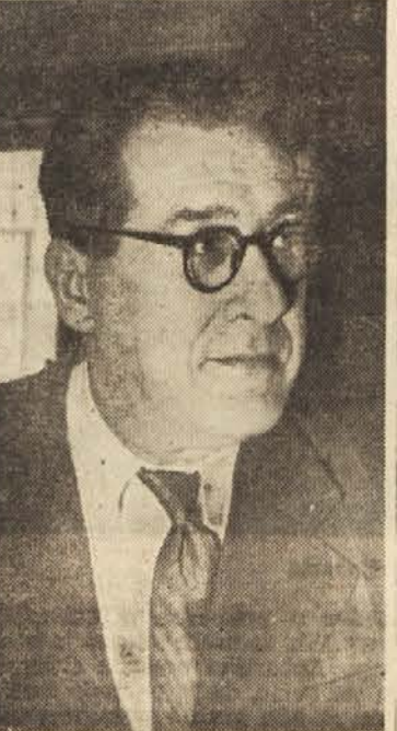
Dirigent Krešimir Baranović

V minuli sezoni je Beogradska filharmonija dosegla lepe uspehe. Njeni koncerti so v marsičem prispevali k plodnejšemu in bolj raznovrstnemu koncertnemu življenju v Beogradu. Filharmonija je prirejala abonmajске koncerte, dalje koncerte, na katerih so kot solisti nastopali domači in tuji umetniki, koncerte za mladino in druge, na katerih so razen standardnih simfoničnih del izvajali tudi tista,