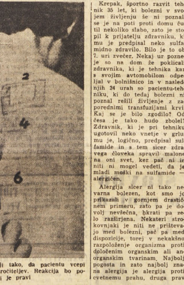
Zdravniki odkrivajo vzrok alergiji tako, da pacientu vcepi ali pricepajo več vrstnih povzročiteljev. Reakcija bo pokazala, kateri je pravi

Gre za bolezen ali za dispozicijo? - Če nas muči, moramo najprej odkriti vzrok - Že stari Egipčani so jo poznali - Rusi jo najbolj sistematično proučujejo