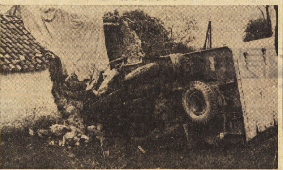
Strašen prizor po trčenju kamiona-hladilnika v hišo pri Senadolicah

Kamion-hladilnik beogradskega podjetja «Transped» je iz neznanih vzrokov tresčil v hišo - Drugi kamion istega podjetja pa je tresčil v drevo