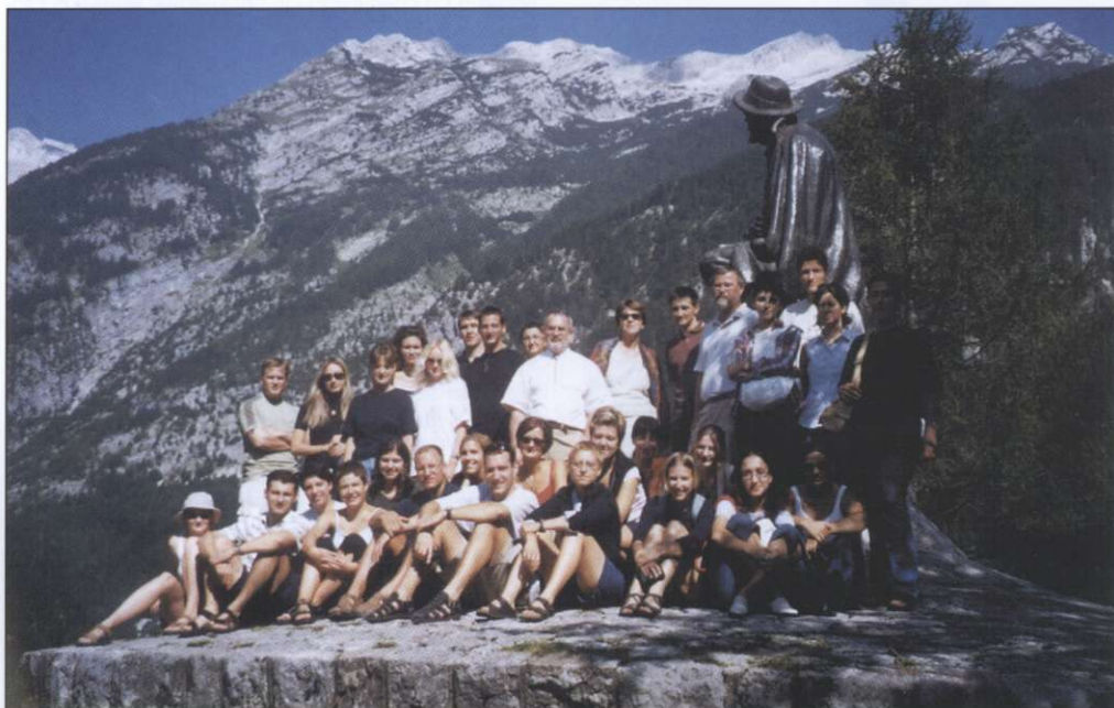
Skupni posnetek udeležencev ekskurzije pri spomeniku J. Kugyja v Trenti.

Tri popoldanska srečanja so bila namenjena delavnicam o nacionalnih stereotipih. Slovensko sku-