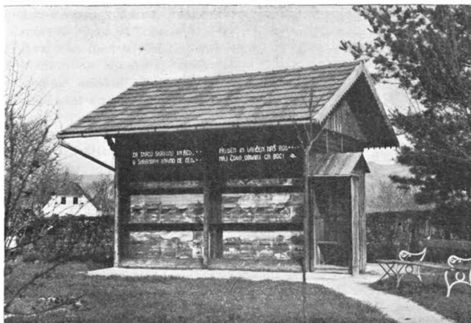
Šolski čebelnjak v št. Rupertu na Dolenjskem v poletnem stanju.