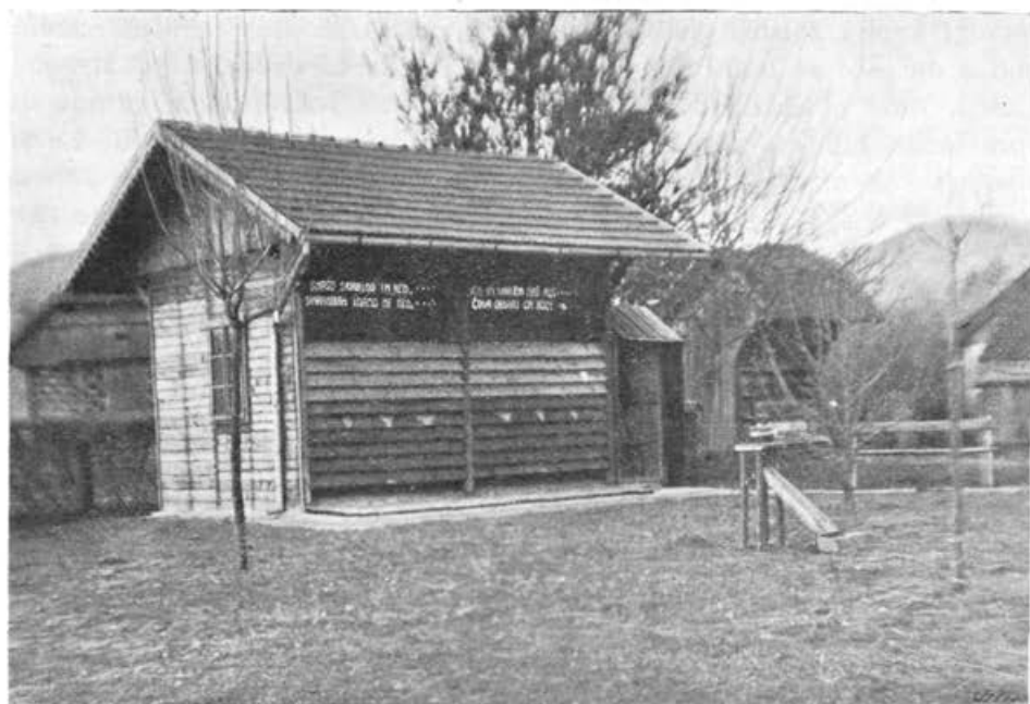
Šolski čebelnjak v št. Rupertu na Dolenjskem v zimskem stanju.