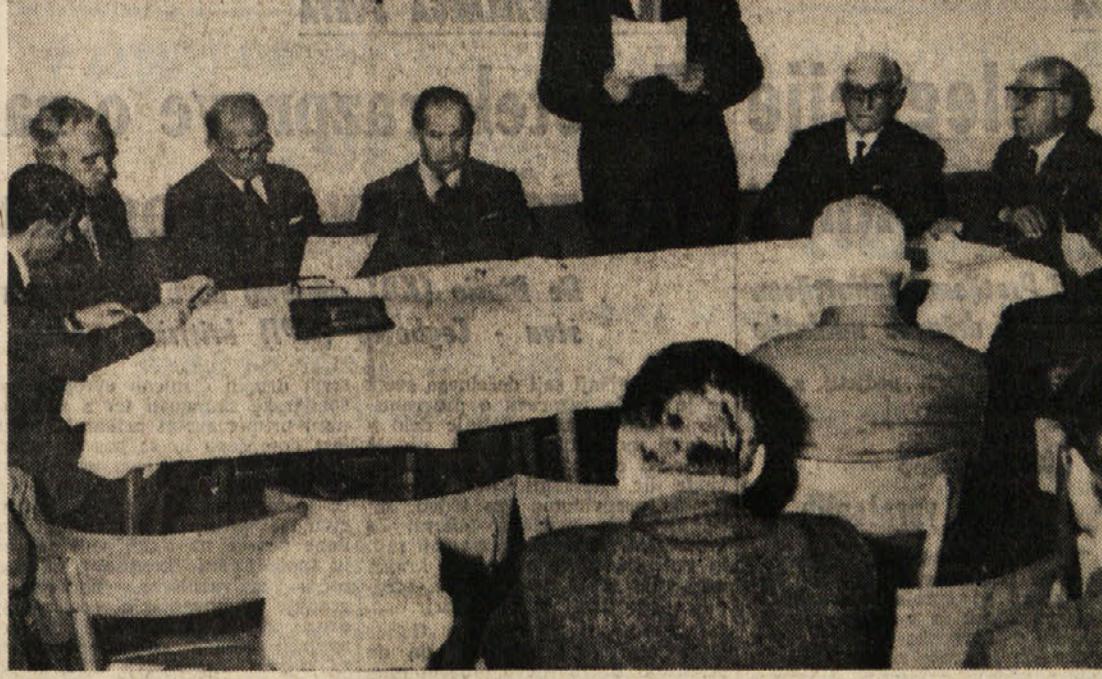
Zadruga «Naš Kras» — kot je že bil o tem govor — je bila ustanovljena, da bi predvsem s svojim delovanjem prispevala k ohranitvi vseh tistih značilnosti naše kraške pokrajine, ki ji med mnogimi drugimi dajejo prav poseben in enkraten pečat. Zlasti ne bo odveč poudariti še enkrat, da gre med najbolj žive elemente teh značilnosti uvrstiti duha, koloriti, svojstveno patino naših okoljskih naselij, ki neizpodbitno dokazujejo, da tu že stoletja to zemljo naseljuje slovenski človek. Na sliki delovno predsedstvo zadruga na občnem zboru, ki je bil v soboto zvečer v Velikem Repnu