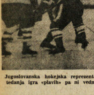
Jugoslovanska hokejska reprezentanca se je pred prvenstvom med drugim srečala tudi z Japonci, tedanja igra «plavim» pa ni vedno dopuščala upanja na tako uspešne nastope, kot jih opravljata to moštvo zdaj na svetovnem prvenstvu

AUSOSIEMENS: Brega 9, Turra 11, Ongaro 10, Rossetti 8, Danie-