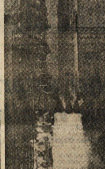
Vesoljsko ladjo «Apollo 9» so izstrelili v ponedeljek ob 17. uri po italijanskem času. Na sliki orjaška raketa nekaj trenutkov potem, ko so prižigali motorje