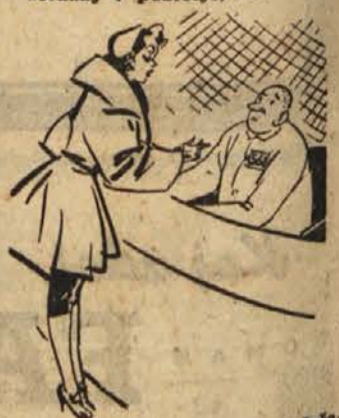
»Sodnikom povej, da ima drža-va izgubo, če ne smeš delati in ne plačuješ dohodnine.«