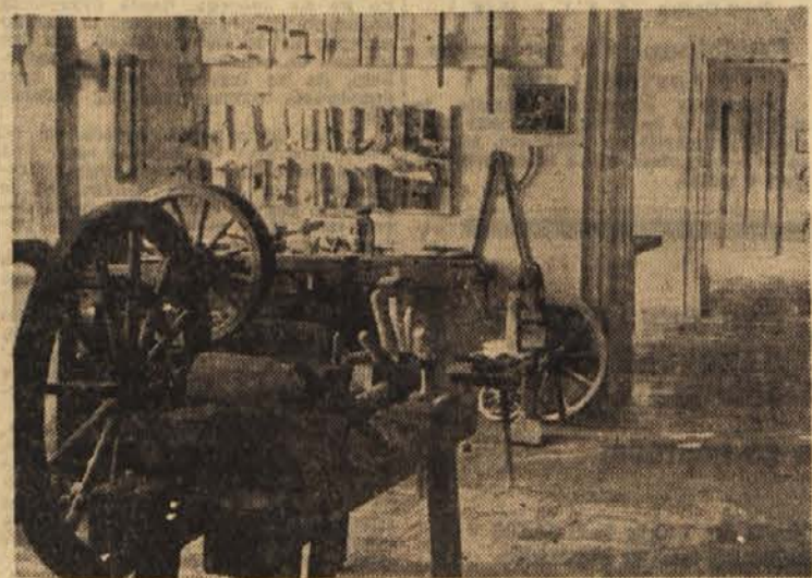
V novoodprtem muzeju lesno-gozdarske in lovske stroke v Bistri pri Borovnici so v velikih grajskih sobanah razstavljene vse vrste dreves, ki rastejo pri nas v Sloveniji, z vsemi posebnostmi, dalje prvi, še primitivni stroji za obdelavo lesa, nekaj umetnih lesenih izdelkov itd. V posebni sobi pa je prikazano živalstvo, ki si je izbralo za svoja bivališča naše bogate gozdove