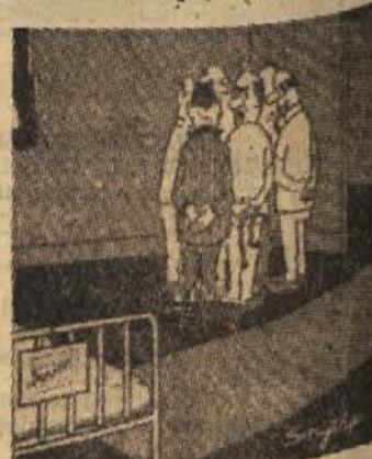
»Nazaj v posteljo, Motovilce«