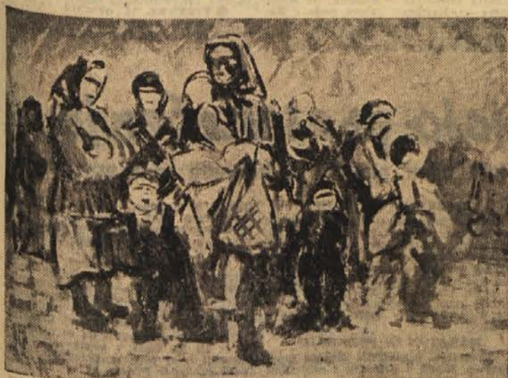
Vito Globočnik: Begunci