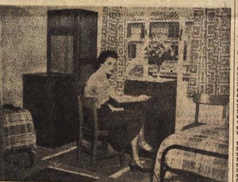
Olimpijska vas že čaka na prve tekmovalce. Naša slika prikazuje spalnico ene izmed olimpijskih hišic

Sodeč po malem številu priložb velja splošna pohvala o napredku tudi sojenju. Z izjemo nekaterih domačih sodnikov — mislimo predvsem na tuzlanske — bi le v redkih primerih lahko zamerili pristranost, ki je bila doslej največja spotika gostujočih moštev. Kakovosti sojenja pa bi lahko očitali mnogo več. Čeprav so sodniki letos prvič srečali v praksi nekatere izvirnosti košarkarskih pravil, ne bi smeli biti presenečeni, kot se je to večkrat pripetilo. Razen tega je še dalje ostalo odprto vprašanje osebni napak in kriterija, ki se mora ustaliti. Med najbolj bodrilne stvari sodi tudi nenehno naraščanje lastnih dohodkov v vseh košarkarskih centrih, razen v Zagrebu in do neke mere v Beogradu. Le-tu še dolgo ne bodo mogli nafti ugodne rešitve v preobličju vabljivih športnih tekmovalcev — zlasti nogometnih srečanj. Za zdaj je čas, da pomislimo na odlično rešitev, ki bi na mah razčistila finančno krizo. Z izgradnjo veselejskih dvoran v Beogradu, Zagrebu in Ljubljani se je ponudila priložnost, predstaviti ko-