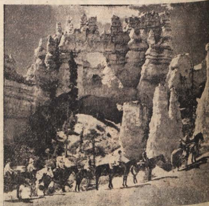
Čudovita igra narave je skal-nati grad v nekem kanjonu ameriške države Utah. To tu-ristično zanimivost si prihajajo ogledovati številni ljudje, vendar pa je treba zaradi ve-like oddaljenosti in nepreohod-ne pokrajine najeti konja za jahanje in vodiča

Toda gondoljeri niso prenehali z bojem s tehniko. Čeprav se premočni sovražnik, opremljen z radarjem, vozi okrog Benetk tudi v največji megli in njihove gon-dole sodijo že v zgodovino, se z resignirano trdovratnostjo upi-rajo usodi, ki jim jo je pred 75 leti določil osvovraženi renegat »Francoz«.