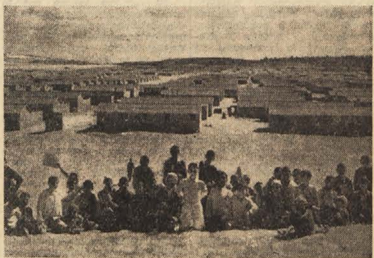
Taborišče iz Izraela pregnanih beguncev v Jordaniji

Po sestanku izraelske vlade so objavili sporočilo, v katerem je rečeno, da je vlada s »presenečenjem in zaskrbljenostjo« sprejela sklep britanskega zunanjega ministrstva, da bo v celoti uvelja-