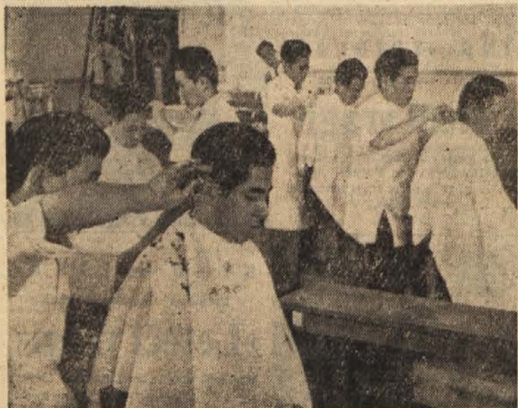
Razen mnogih drugih del, ki jih opravljajo, da si zaslužijo sredstva za študij in življenje, nastopajo japonski slušatelji visokih šol tudi kot »preizkusni zajčki« pri frizerjih, ki de-lajo pomočnike in mojstrske izpite