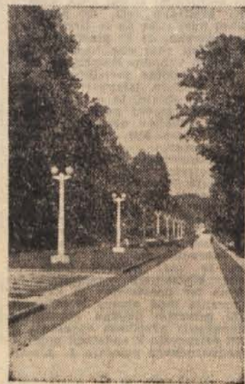
Iz mariborskega parka

nih sredstev nudi za vzdrževanje doma in za boljšo oskrbo učencev Zvezarna Ravne, najmanj pa Tovarna avtomobilov in Železniška delavnica v Mariboru. Dom učencev Industrijske kovinarske šole je nov in dobro opremljen. Ker pa nima nobenih dohodkov razen oskrbnine, vzdrževanje ni zadovoljivo. Precej je bilo okvar