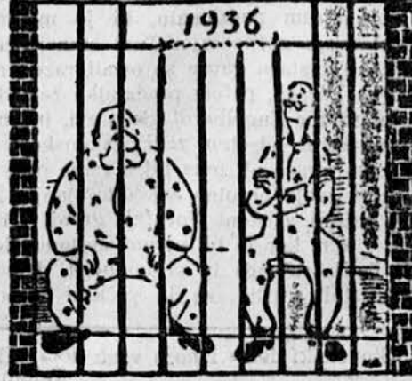
*Ivljenje za mrežo