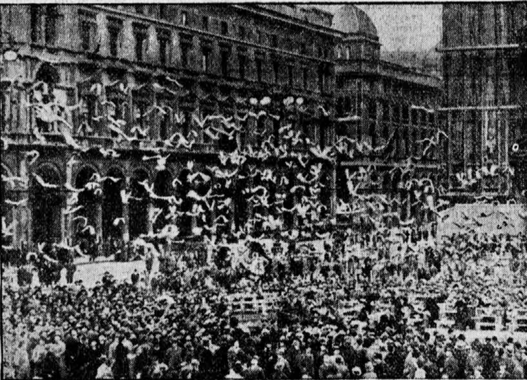
Tisoč poštinih golobov so na dan obletnice fašistske stranke poslali iz Milana v Rim v pozdrav Musso liniji.

Zdravnik: Rekel sem vam, da morate v primeru nespečnosti neprestano in zbrano šteti. Nervozni: »Saj sem štel do petdeset tisoč.« Zdravnik: »In potem ste seveda zaspali?« Nervozni: Niti malo. Potem je bilo že ča: vstati.«