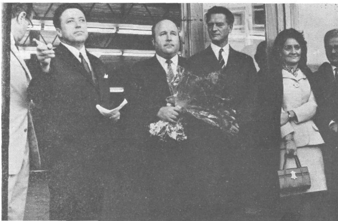
Šišenska nevesta je po osmih letih zakona prinesla Šentvidu obljubljeni doto. Ob otvoritvi telovadnice v Šentvidu

Izvoljeni so bili soglasno. Njihova naloga bo sodelovati na sejah skupščine in zastopati stališča občinske skupščine, svetov in komisij. Pravico do glasovanja ima samo en izvoljeni delegat.