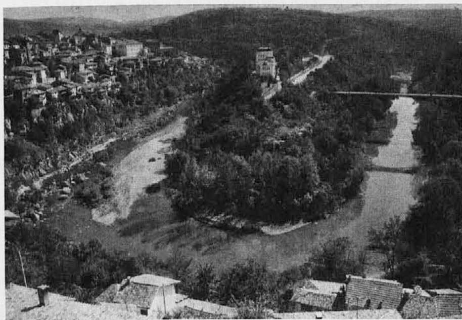
Pogled na del mesta Trnovo in na reko Jantra, ki se v obliki dvojne črke S vije okrog mesta

Prireditelji smejo biti z doseženim uspehom IV. zamejskega festivala narodno zabavne glasbe zelo zadovoljni. Trud, skrb in požrtvovalnost števerjanske mladine so ponovno prišli do polnega izraza. Naj bi bilo tako tudi prihodnje leto! —ej