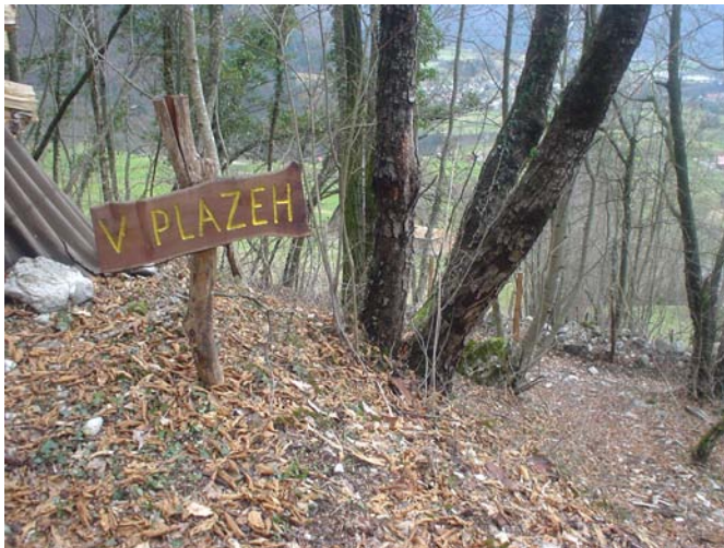
Slika 7: Tabla na začetku poti Zatoľmin–Sleme, v ozadju pogled na Tolminsko kotlino [foto: H. Čujec Stres, februar 2007].

Ker ledinska imena niso več v vsakdanji rabi, izginjajo iz zavesti mlajših govorcev. Kljub temu jih ti želijo ohraniti in to čim bolj takšna, kakor so jih uporabljali njihovi očetje in dedi. Postavitev tabel (sl. 7) s ključnimi ledinskimi imeni na poti od vasi Zatoľmin do planine Sleme naj bi spodbudila njihovo rabo in z ustreznim zapisom prispevala k uzavestiti ledinskih imen pri ljudeh. Anketa kaže, da je treba ledinska imena dosledno zapisovati na način, ki bo sodobnemu laičnemu govorncu omogočil stik z živim jezikom. Le na ta način bodo lahko imena prešla tudi v naslednje rodove, saj jim glede na strm upad poznavanja pri mlajši generaciji grozi popolna pozaba. Povsem narečni zapis za uporabo na tablah ni primeren, saj fonetični znaki laičnemu govorncu in bralcu otežujejo ali celo onemogočajo stik z zapisanim. Prav tako ni primeren povsem knjižni zapis, saj se z njim zgublja živost narečnega govora. Predlog torej je, da se pri zapisu ledinskih imen na javnih krajih upošteva nekakšna mešana raba narečnega in knjižnega.