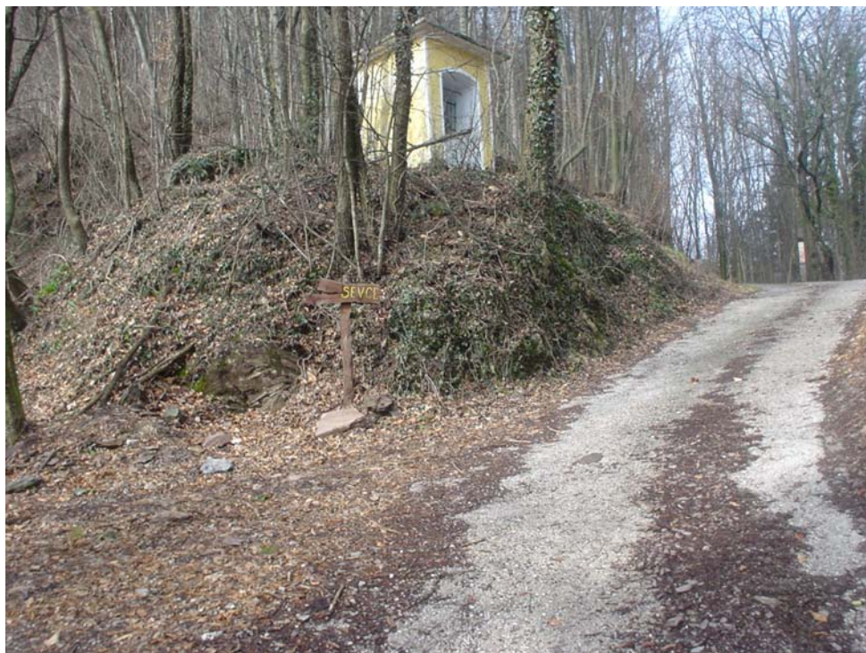
Slika 6: Tabla ob poti Zatolmin–Sleme, na vidnem mestu, da jo mimoidoči zlahka opazijo.

V letu 2006 se je v vasi porodila želja, da bi zbudili zanimanje pohodnikov za imena posamičnih območij na poti Zatolmin–Planina Sleme, ki je še najbolj obiskovana. Pot vodi med (nekoč poimenovanimi) prej senožetmi, pašniki, zdaj povečini gozdovi. Zato je bilo ob poti Zatolmin, Zavrh, Stena, Zagrmuč, Pretovč, Planina Sleme postavljenih 12 lesenih znakov/tabel, izdelanih iz klanega negnojevega lesa, 4 z vdolbenimi in rumeno pobarvanimi imeni posamičnih področij (sl. 5). Znamenja naj bi zbudila zanimanje za imena gozdov, pašnikov, izvirov, planin, hkrati pa bi pohodnikom sporočala, kje na poti so.