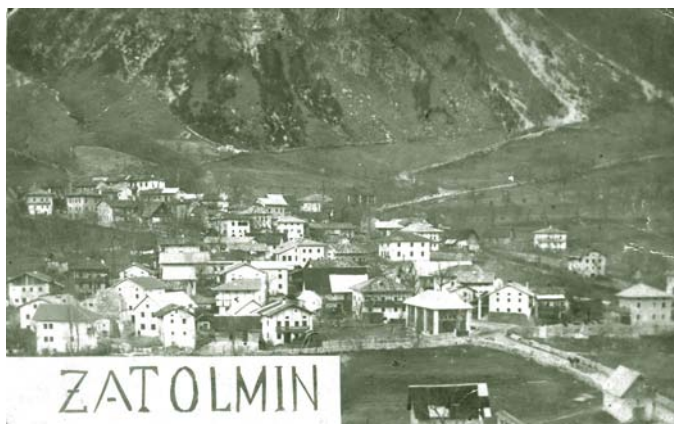
Slika 1: Pogled na vas Zatolmin po 1.svetovni vojni. Dobro vidne so nezaraščene površine v okolici vasi in višje po pobočju Vodil vrha.

Vas je že od nekdaj (sl. 1) pomaknjena visoko v breg, da je na južnem robu ostala ravna in rodovitna zemlja za obdelovanje in pridelovanje. Ustno izročilo pripoveduje, da so prve hiše nastajale ob obronkih ravnega sveta in se je vas zaradi staj za živino začela širiti v breg, kjer so svet krčili revnejši kmetje in tam ustvarjali laze in rute, gune, senožeti in pašnike po pobočjih vse do vrha Vodil vrh. Ker so se v preteklosti