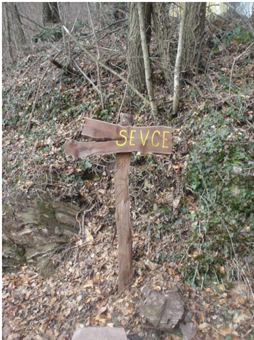
Slika 5: Primer postavljene table iz negojevega lesa na poti Zatolmin–Planina Sleme [foto: H. Čujec Stres, februar 2007].

V splošnem se v primerjavi s starejšimi viri pojavlja tendenca, da izginja poimenovanje z neko drugo značilnostjo in se spreminja v poimenovanje po lastniku parcele. Nadaljni razvoj v tej smeri bi bilo potrebno omejiti ali ustaviti, da bi se ohranilo bogastvo ljudskega izročila.