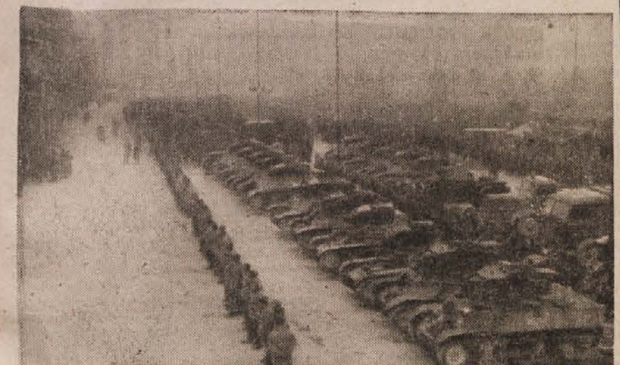
Defile tankov na Kongresnem trgu v Ljubljani ob priliki proslave osvoboditve Beograda

V nedeljo dne 28. t. m. bo literarni večer z istim sporedom v Ptuj.