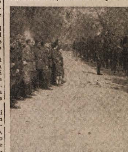
Konjenica Jugoslovanske armade v defileju (Ljubljana, 20. okt. 1945)

Včasih so v vojaku ubijali pravico, da bi se zanimal za politiko. Bivša jugoslovanska armada je bila čreda ljudi, ki niso smeli samostojno misliti; dejali so, da mislijo zanje drugi, vojniki pa da smejo izvrševati le povelja. Pojdi danes v vojašnico! Vidiš stenske časopise, v katerih preprosti in zavedni borci pišejo svoje sestavke, v njih pozivajo na volitve, v njih spominjajo na svoje padle tovariše, zaradi katerih je dolžnost slehernega državljanca, da se jim oddolži s tem, da gre na volitve in da glasuje za novo ljudsko oblast, za katero so oni prelili svojo kri; vidiš danes v vojašnici kulturno-prosvet-