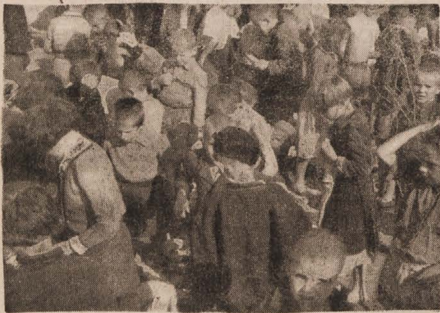
Bosanski in hercegovski otroci se prav dobro počutijo med bratskimi slovenskimi pionirji