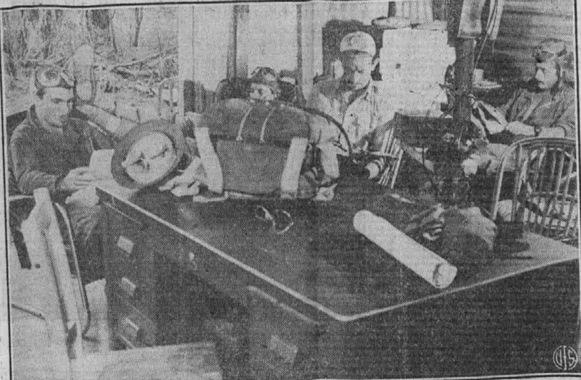
Gornja slika nam predstavlja ameriške pilote v pottropskih krajih Avstralije, kjer so pripravljani, da takoj stopijo v akcijo, kakar hitro bi bilo dano znamenje, da se bliža Japonec.