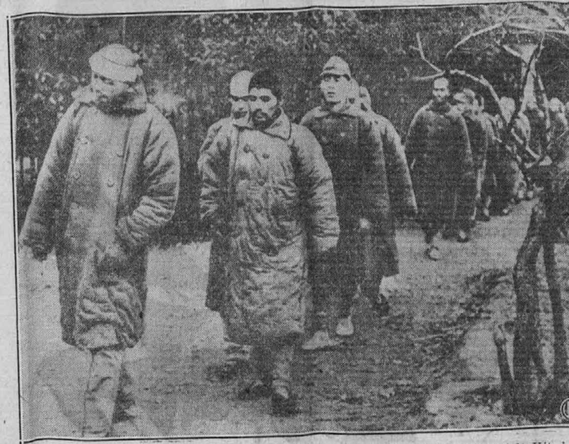
Na sliki vidimo skupino japonskih častnikov in vojakov, ki so jih zajeli Kitajci v bojih pri Changsha. Obklečeni so še v zimski obleki, kajti zima v tistih krajih drži od septembra do marca. V bojih pri Changsha so bili Japonce krvavo poraženi od Kitajcev.