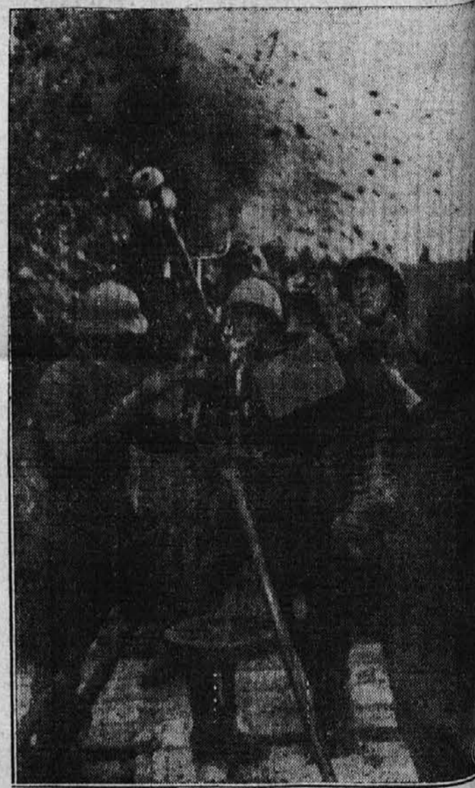
Ruski vojaki neustrašno stojijo pri svojem topu, da v njih neposredni bližini pokajo sovražne bombe. Gornja slika je bila povzeta v krvavi bitki za stopol.