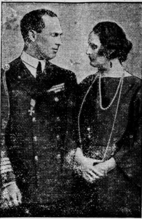
bivši grški kralj Jurij in kraljica Elizabeta. Vzrok je baje neka ženska angleškega rodu, ki je stopila med njiju...