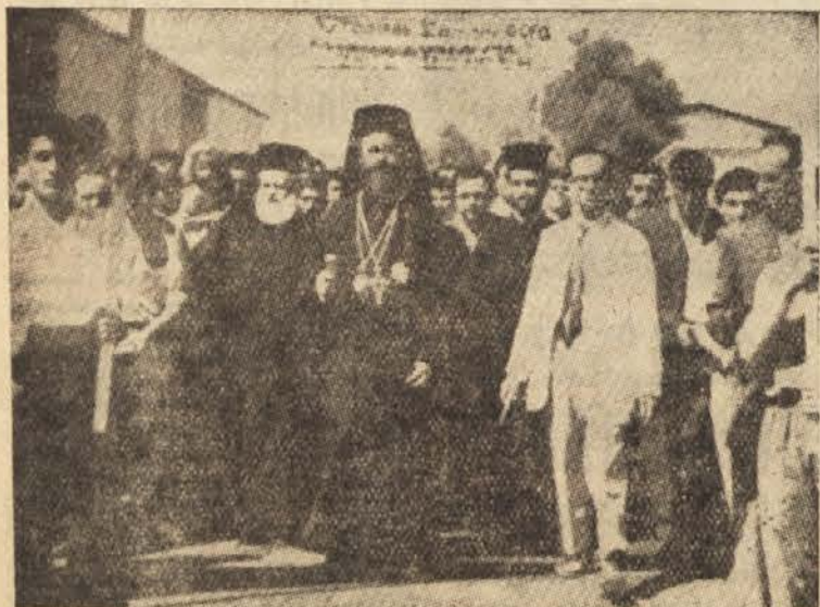
S Cipra: arhiepiskop Makarios sredi delavcev, ki protestirajo proti britanskim ukrepom