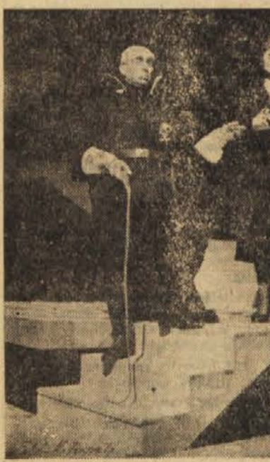
Jemlj. zato je bila zamišljena stopnja njim pred publiko z že odrejenimi okusom, nekoliko tvegana. Mnenja so bila — kot je običajno pri vsaki novitvi — ob premieri zelo deljena. Revolucionarni idejni zanos pisatelja pa je kljub vsemu prispeval k temu, da se je sodba gledalcev naglala v

V soboto je mariborsko Drama pričetla svojo novo sezono. V duhu letošnje repertoarja, ki je povezan predvsem sodobni evropski dramatik, so za otvoritev uprizorili dramo francoskega avtorja Alberta Camusa »Obsedno stanje«. Delo je znano po modernih dramaturških pri-