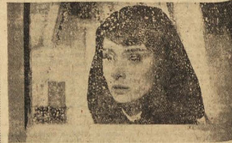
Nataša — Audrey Hepburn žalostno gleda skozi okno, vtem ko »unaj sneži«

Kakor vidimo, hočejo napraviti velik film. Ali pa se jim bo posrelo ustvariti film, ki bo na vsi Tolstojevе umetnine, bomo šele videli.