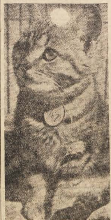
Mačica, po imenu Fifi, je na tekmovalstvu najlepših mačk v Londonu odnesla prvo nagrado

Kaj nudi človeku spanje v fizičnem oziru? Obrabljene snovi izloča organizem v spanju hitreje kakor v bedenju. Ko živci in mišične celice bededečega človeka delujejo, je to združeno s porabo njihovih snovi, predvsem beljakovin. Celice lahko pri tem izgube precej svojih delovnih sposobnosti. V spanju, ko delo počiva, pa človeško telo s hrano nadomesti porabljene snovi. Spanje, ki ga motijo sanje, zlasti neprijetne, človeka nikoli ne poživi tako, kakor spanje brez sanj.