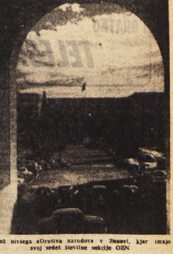
Sedež bivšega «Društva narodov» v Ženevi, kjer imajo svoj sedež številne sekcije OZN

1957-58 2.000 » » » » 1958-59 3.000 » » » » 1959-60 3.000 » » » » 1960-61 4.000 » » » » 1961-62 4.000 » » » » 1962-63 3.750 » » » »