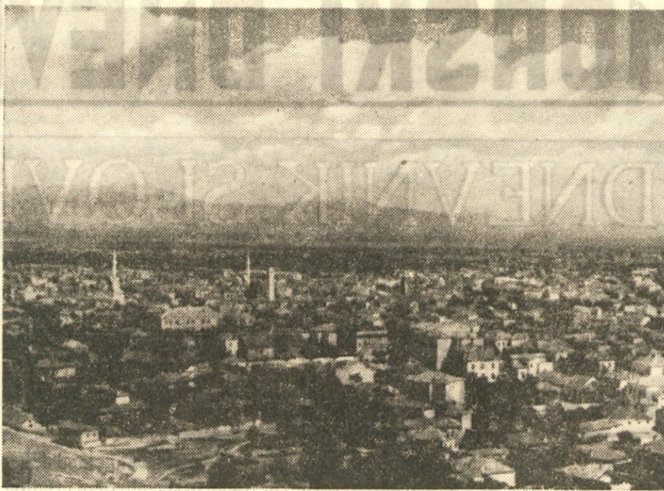
Bitolj, glavno mesto Pelagonije v Ljudski republiki Makedoniji

sprejele 450 potnikov. Računa se, da bodo te tri ladjje dovršene v letih 1956 in 1957. Z vztrajnim in požrtvovalnim delom jugoslovanskih delavcev vidimo, kako se sicer počasi, toda vztrajno poraja mlada, krepka jugoslovanska trgovinska mornarica, ki bo odprla tako jugoslovanskemu turizmu kot pomorskemu tovornemu prometu boljše perspektive, takšne, ki ji bodo omogočile, da bo lahko v dobršni meri bolj in bolj prispevala k splošnemu razvoju jugoslovanskega gospodarstva.