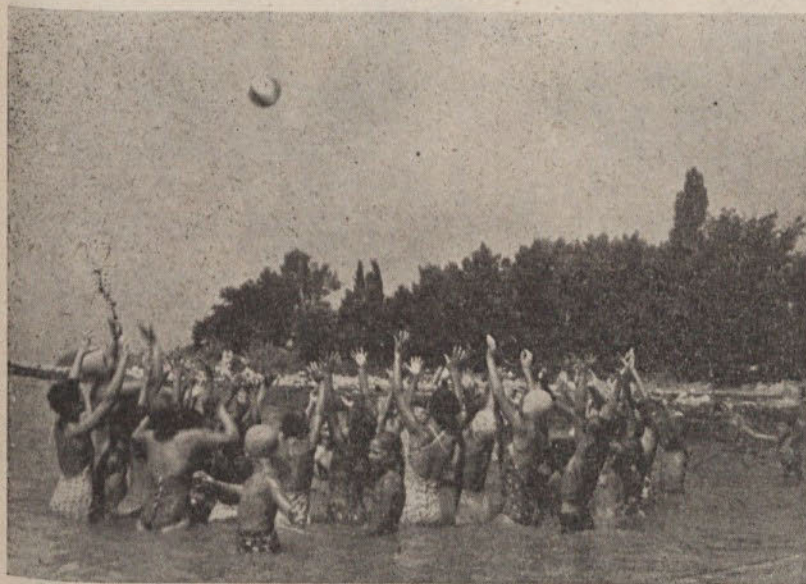
Ob veselem razvedrilu so jim hitro potekale počitnice

či. Zakaj visi v zraku oblaček veselje vznemirjenosti in pričakovanja in je vanj ovit ves ta neukrotljivi živ-žav?