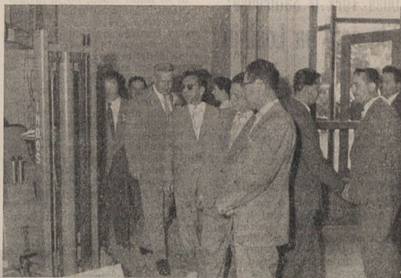
Razstavo je obiskalo veliko število obiskovalcev. Na sliki vidimo goste, ki si ogledujejo razstavne prostore

Tovarna kleja je bila ustanovljena l. 1882 — sodi torej med najstarejše tovarne v Ljubljani.