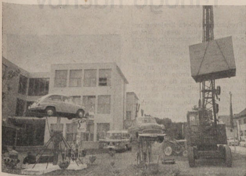
Nekatera podjetja so razstavljala tudi na prostem

tomobilске plašče vseh vrst, po naročilu pa izdelujejo tudi razne gumijaste predmete. Koliko je to podjetje razširilo svojo dejavnost je razvidno iz sledečih podatkov: l. 1952 je protektirano 1.934 avtomobilskih plaščev razne velikosti, v minulemu letu pa 9.226!