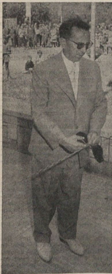
Predsednik ObLO Moste-Polje (ov. Fain) otvarja razstavo

Za vsa kemična podjetja v naši komunni pa velja splošna ugotovitev: tovarne so v rokah dobrih gospodarjev, ki niso zadovoljni z majhnimi delovnimi zmagami, marveč stremijo za čimvečjim delovnim učinkom, kar se vsem članom delovnih kolektivov bogato obrestuje.