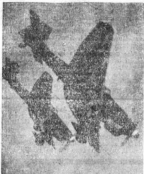
Nemški bombniki v strmoglavem napadu

Zadnja poročila pravijo, da postavljajo Nemci ob vsej obali v Rokavskem prelivu od Holandije do Cherbourga dalekostrelne težke topove najmodernejšega tipa. Medtem ko bodo topovi ob severnem ustju preliva imeli nalogo držati v šahu