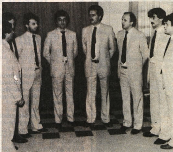
OKTET VITIS – Na proslavi, posvečeni osmemu marcu, je pel tudi oktet Vitis. Prireditev je bila v restavraciji naše delovne organizacije. Oktet Vitis poje že dobra štiri leta in četudi je doživel več kadrovskih sprememb, je njegovo petje ubrano. Fantje so nastopili tudi v Mirni peči.