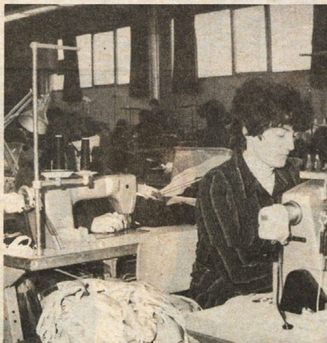
BOJ ZA IZVOZ – V eno od prednostnih nalog našega gospodarstva se uspešno vključujejo tudi v črnomaljski konfekciji. Na sliki je prizor iz šivalnice, kjer dekleta šivajo kopalke, ki jih uspešno prodajamo tudi preko naših državnih meja. Vsaka deviza je namreč še kako dobrodošla.