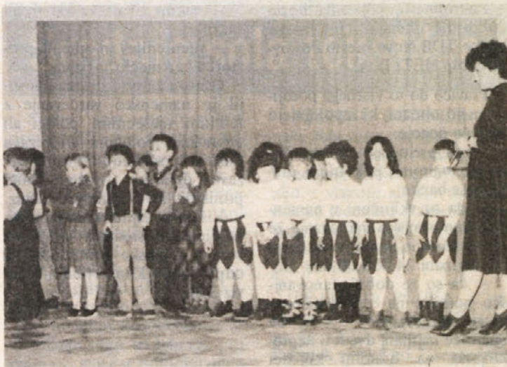
VRTIČKARJI – Otroci so zmeraj zanimivi, še posebno pa takrat, ko nastopajo na odru. Naše delavke so razveselili ob osmem marcu. Poželi so veliko aplavza.