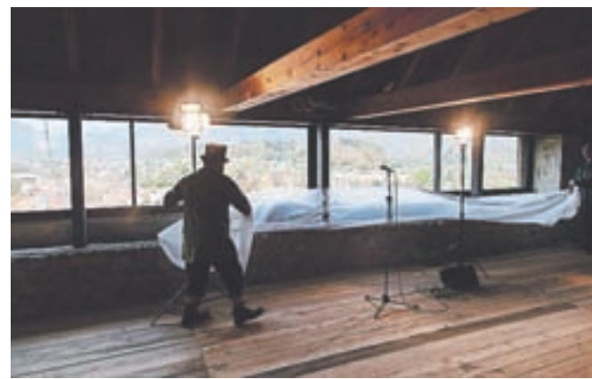
Odprtje razgleda s stražnega stolpa