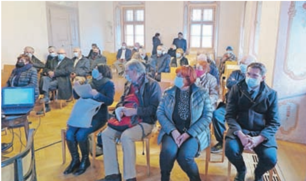
Zbrani na predstavitvi Maistrove poti na gradu Zaprice

Povezati vse ustanove ni bil mačji kašelj, za to pa sta poskrbela koordinatorska