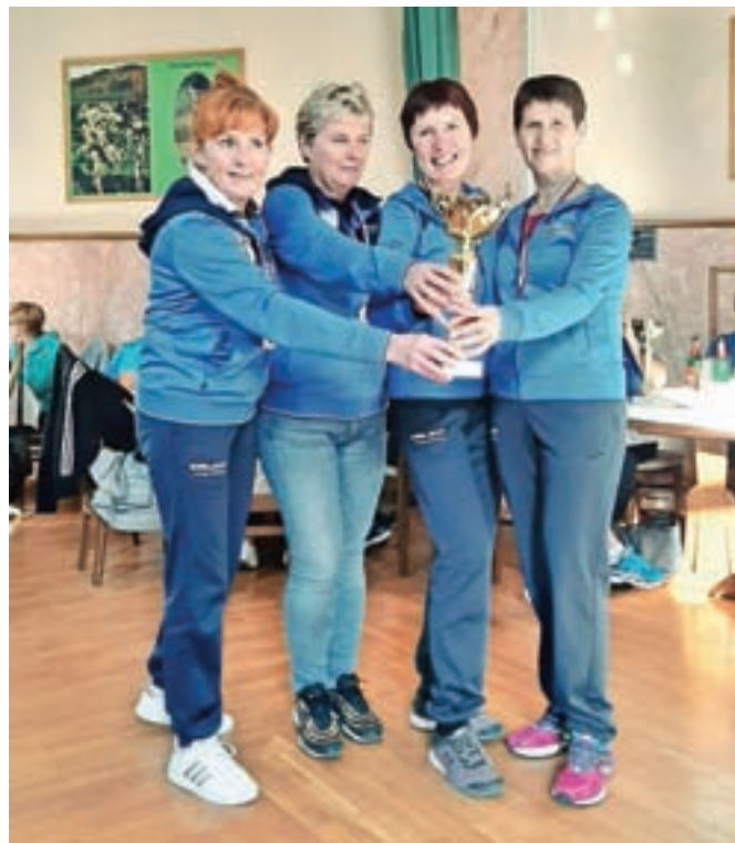
Članice Kegljaške sekcije DU Kamnik so na državnem prvenstvu osvojile prvo mesto.