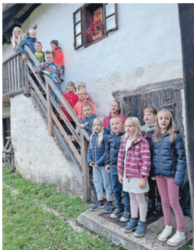
Učenci Podružnične šole Vranja Peč pred Budnarjevo domačijo