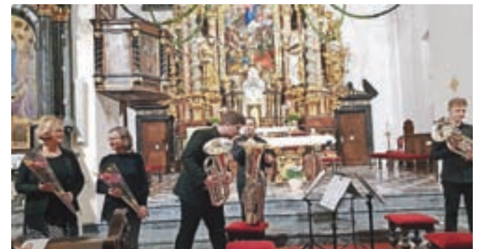
Nastopajoči na sklepem koncertu letošnjega cikla Musica aeterna/Živa glasba.