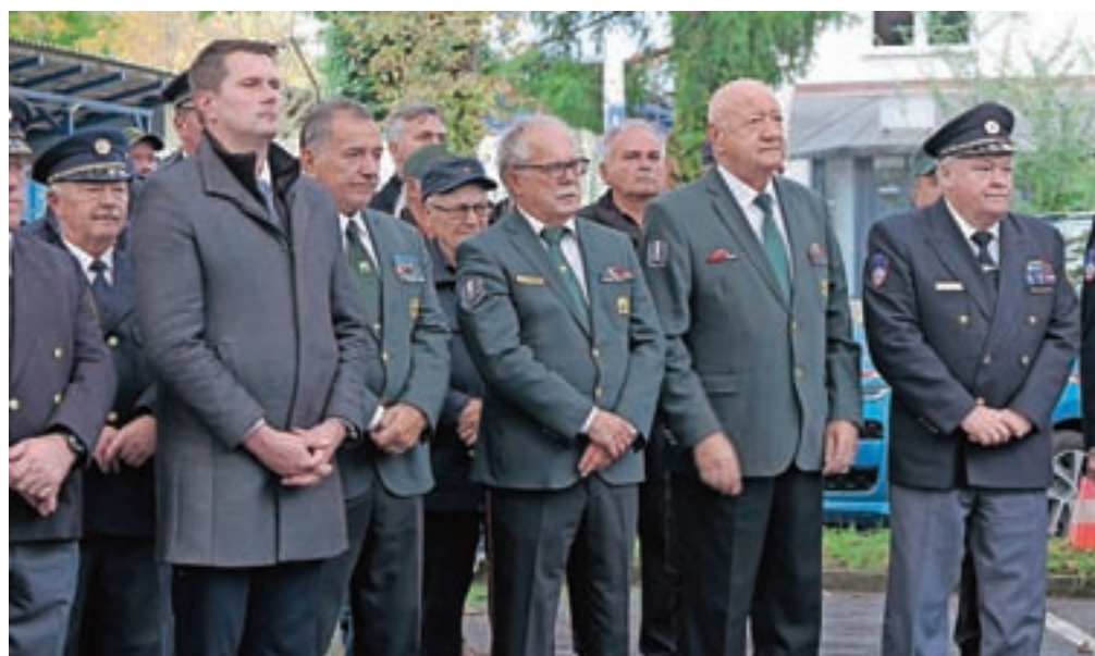
Zbrani na veteranski proslavi ob dnevu suverenosti v Kamniku

Z dnevom suverenosti se spominjamo dogodkov, ki so se zgodili v noči na 26. oktober leta 1991, ko je ozemlje Slovenije zapustil še zadnji vojak JLA, s čimer se je končal proces slovenskega osamosvajanja. Jugoslovanska vojska se je iz pristanišča v Kopru sicer začela umikati že 20. oktobra, 25. oktober pa je bil določen kot zadnji dan umika. Zadnji vojaki JLA so ozemlje Slovenije zapustili 25. oktobra 1991 ob 23.45.