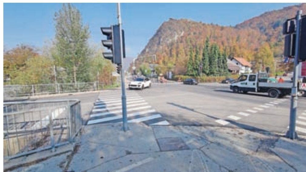
Prenovljeno križišče pri srednješolskem centru

In čeprav se bliža zima, gradbene sezone še ni konec. V teku so namreč trije občinski razpisi za še tri gradbišča. Občina namreč išče izvajalce za gradnjo testne vrtnice pri zajetju Iverje v Stahovici, za posodobitev vodovodnega sistema na Zduši, saj zadnje hiše že nimajo zadostnega pritiska v vodovodnih cevih, in prenavo vodovoda in kanalizacije na delu Vrhpolj.