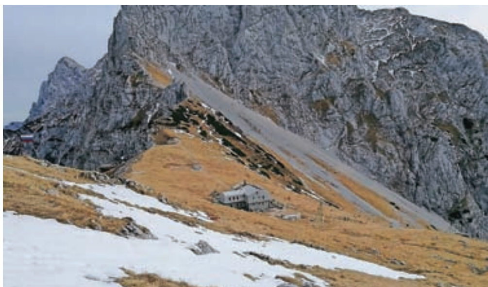
Kamniška koča na Kamniškem sedlu je že zaprta, a bo osnovno oskrbo obiskovalcem ob lepih koncih tedna nudila tudi čez zimo.

Tečaj varne hoje v gorah pozimi bodo člani Gorske reševalne službe Kamnik letos organizirali v soboto, 20. novembra. Razpis je objavljen na njihovi spletni strani.