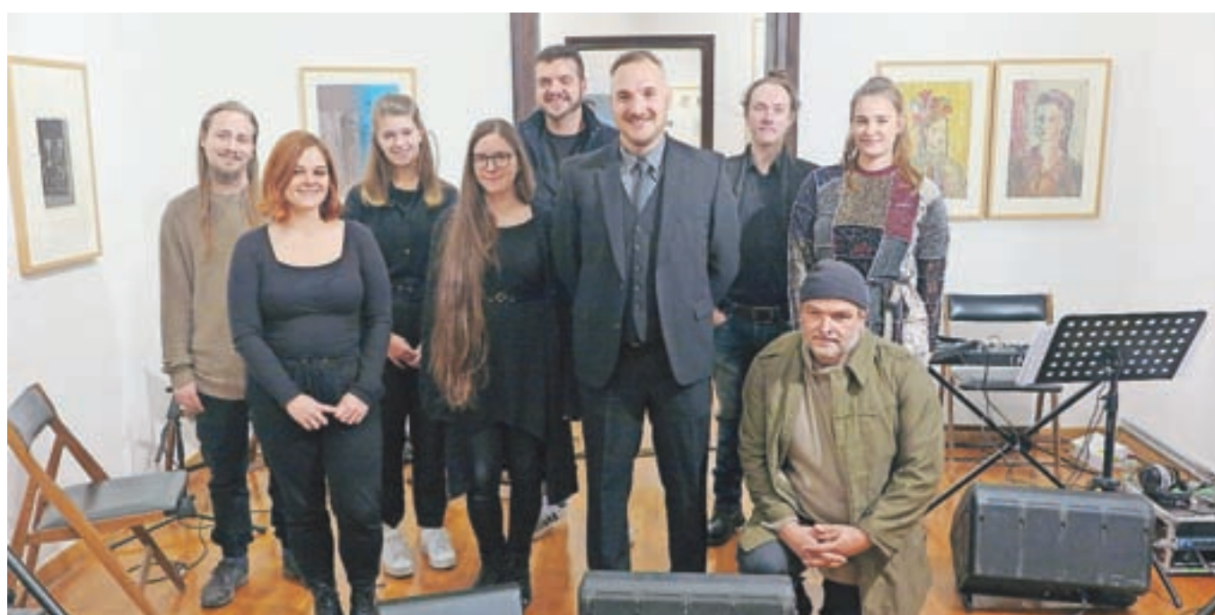
Na predstavitvenem koncertu so nastopili tudi vsi, ki so sodelovali na albumu.