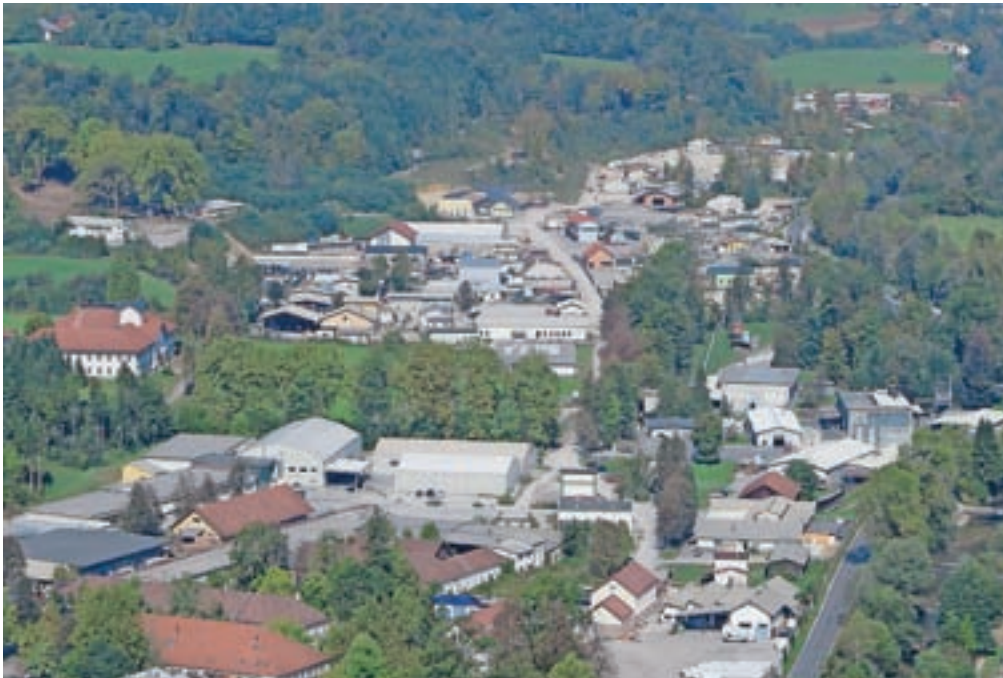
Občina Kamnik ima v lasti že skorajda vse ceste na območju nekdanje smodnišnice.

Območje se bo celovito lahko uredilo šele po sprejetju občinskega podrobnega prostorskega načrta (OPPN), za katerega je osnutek že pripravljen, prav tako so nanj pristojni nosilci urejanja izdali ustrezne smernice in z njimi zahtevali pripravo študij. Skladno s tem so bile do sedaj izdelane že tri strokovne študije, in sicer terenske in laboratorijske raziskave podzemnih in površinskih voda ter zemljin, konservatorski načrt za prenavo območja in idejna zasnova ureditve tujih, zalednih in meteornih voda. Prav prva študija je vodilna na občini najbolj skrbela, saj bi morebitna onesnaženost območja z eksplozivnimi sredstvi oz. ostanki proizvodnje smodnika zahtevala celovito sanacijo in s tem povežane velike stroške ter dolgotrajne postopke. A rezultati so pomirjajoči. »Obseg opravljenih geoloških ter okoljskih raziskav ter pridobljeni rezultati in interpretacije dajejo zadovoljiv vpogled v geološke in okoljske razmere na lokaci-