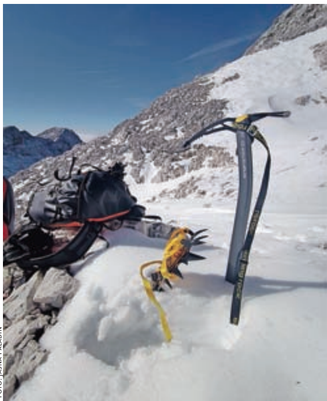
Za obisk visokogorja že potrebujemo zimsko opremo.