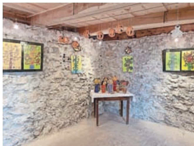
Na razstavi so na ogled izdelki, povezani z jesenjo.

niti ne opazimo. Zgodi se nam tudi, da nismo dovolj pozorni do svojih najmlajših. Zanje pa je pomemben vsak dan, zlasti če ga preživijo ustvarjalno. Prav je, da njihove stvaritve pokažemo in jih z ogledom nagradimo