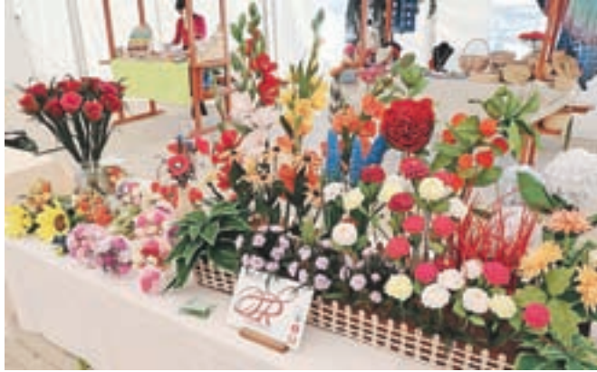
Cvetje iz krep papirja je na razstavi sestavljalo aranžmaje, kjer bi od daleč opazovalec pomislil, da je cvetje pravo.