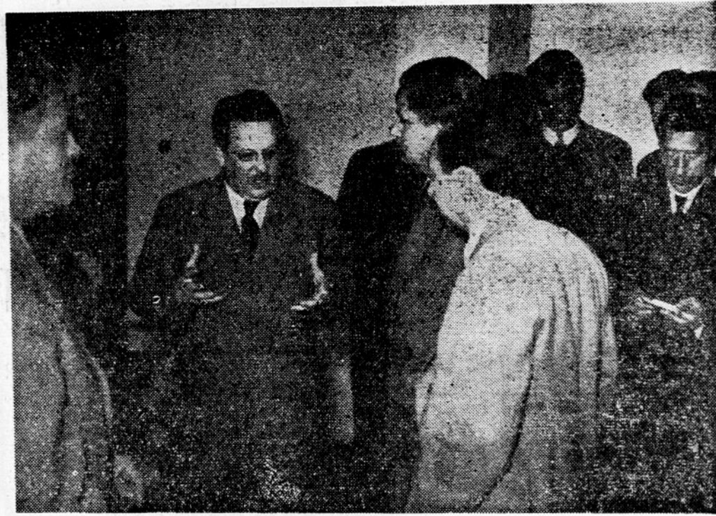
Edvard Kardelj v razgovoru z zastopniki mest v Splitu

Beograd, 8. maja. Odbor za prosveto zveznega zbora se bo sestel 14. maja ob 10 dopoldne, ko bo začel razpravljati o predlogu splošnega zakona o univer-