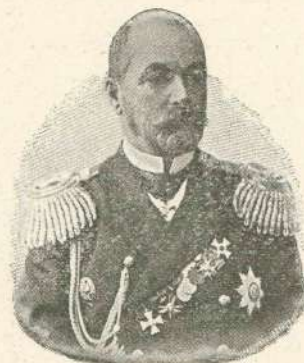
Admiral Roždjestvenskij, poveljnik baltiškega brodogoja.

Od pesniških tvorb zahtevajo današnji čitatelji, da so nove po predmetu, izvirne, neznane po vsebini. V zlo štejejo pisatelju, ako najdejo v njegovem delu kaj takega, kar jim je že znano od drugod.