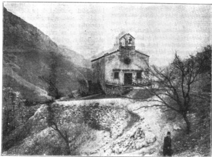
Cerkvica M. B. na Pečéh.