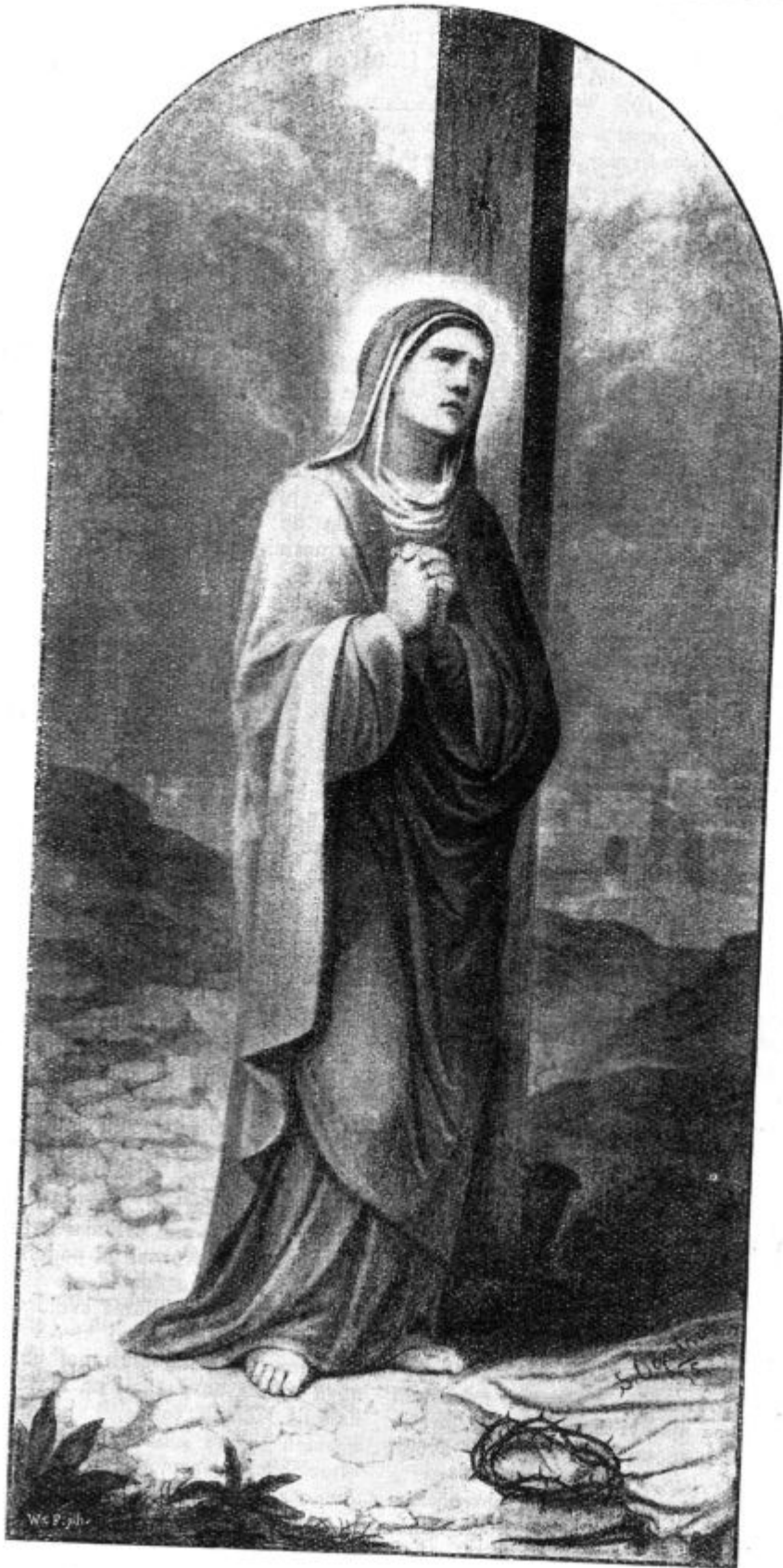
Žalostna Mati — tolažnica žalostnih. (Letos naj bo za majnik Žalostna M. B.)