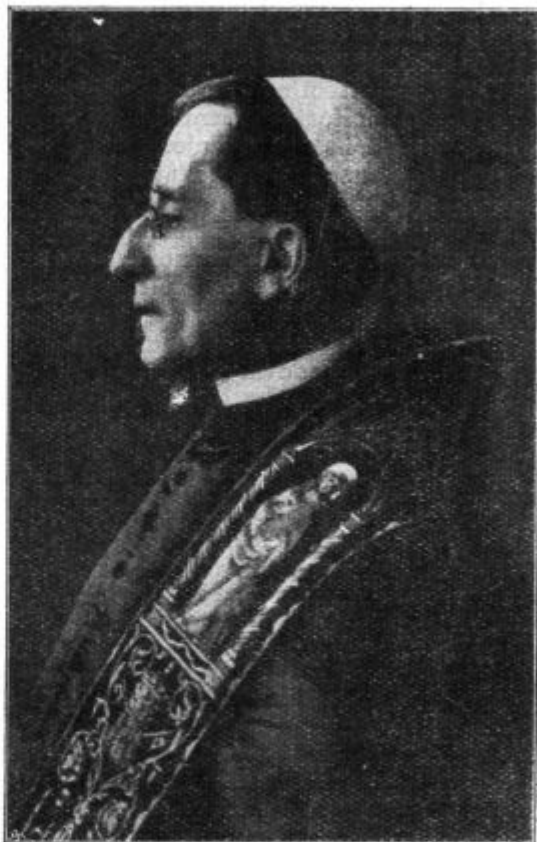
Sv. oče Benedikt XV., velik pospeševalec miru.

Še posebno v naših burnih dnevih kličimo k njemu! Saj je on naš tolažnik po besedah Jezusa samega: »Prosil bom Očeta, da vam bo poslal drugega tolažnika, ki bo pri vas ostal na veke...« O pridi, Sveti Duh... tolaži srca žalostna in vodi jih do Jezusa! Navdahni srca vladajočih z mislimi miru, da se konča strašna, bratomorna vojska, ter se naseli zopet božji mir nad nami. — Ti pa, o Marija, brezmadežna nevesta Sv. Duha, prosi za nas!