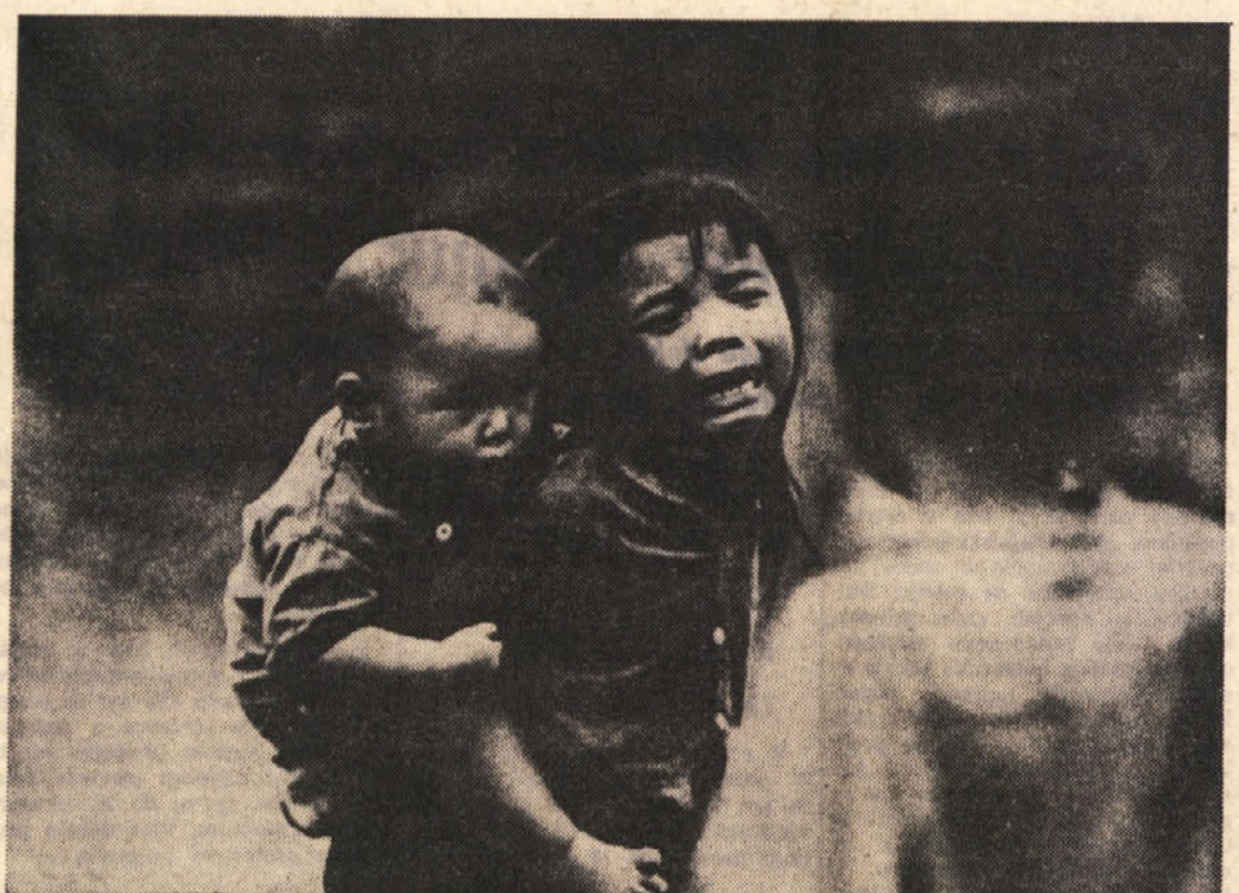
Na račun pomembnih dogodkov drugod, dogodkov, ki so pritegnili nase svetovno pozornost, se o Vietnamu bolj malo govori. To ne pomeni, da se je tam klanje prenehalo.

RIBI (od 20.2. do 20.3.) Ne rešujte vseh vprašanj naenkrat. Bodite bolj kritični in popravite napake, ki ste jih storili.