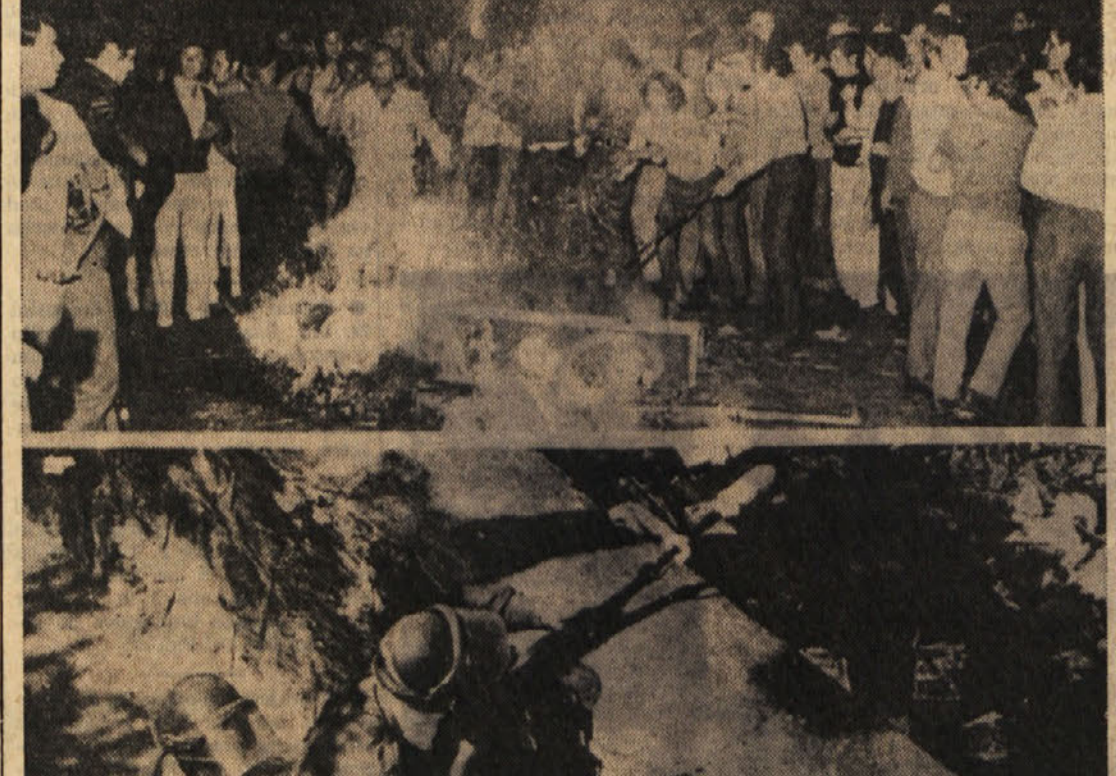
«Kres» na ulici v Reggio Calabria (zgoraj). Policisti izstreljujejo proti demonstrantom solzino bombo (spodaj)

Kardelj je predlagal, da je treba v sklepih jasno povedati, da se določena vprašanja lahko rešijo samo, če se odpove nekaterim zahtevam na področju potrošnje in če se menjajo določene stvari. Po misljenju Kardelja ni prišlo do raznih negativnih pojavov samo zato,