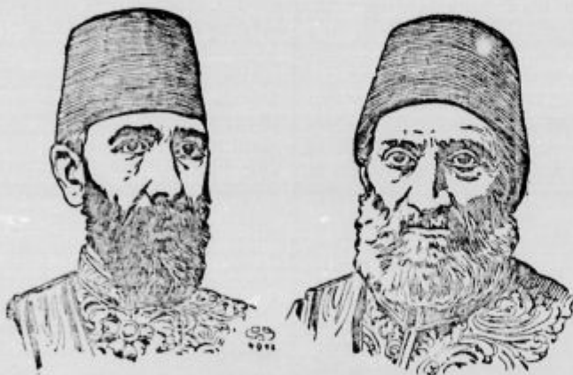
HILMI PAŠA IN KIAMIL PAŠA.

Minula sta skoraj dva meseca, odkar je Lucij v ječi. Že poteka junij. Tu stopi