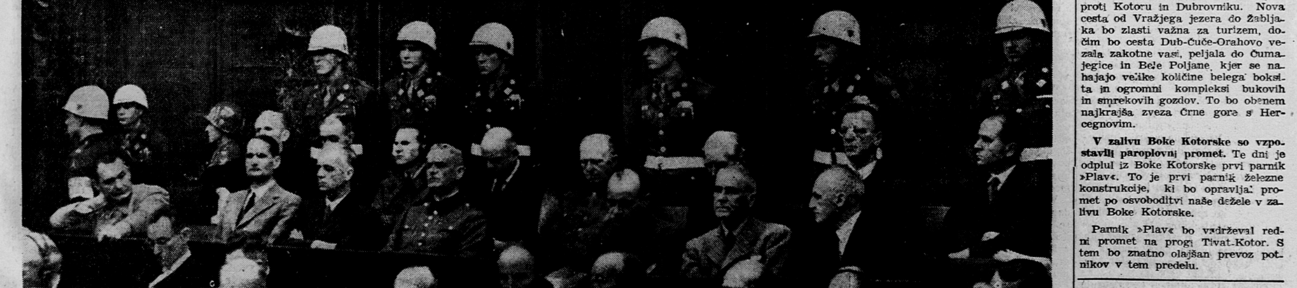
Petnajst izmed dvaindvajsetih največjih nacističnih vojni zločincev na zatožni klopi v Nürnbergu. V prvi vrsti sedijo od leve proti desni: Herman Göring, Rudolf Hess, Joachim von Ribbentrop, Wilhelm von Keitel, Hans Frank, Wilhelm Frick, Julius Streicher. V drugi vrsti sedijo: Dönitz, Erich Raeder, Baldur von Schirach, Fritz Sauckel, Alfred Jodl, Fritz von Papen, Arthur Seyss-Inquart, Albert Speer. — Obtoženi dr. Ley je med sodno razpravo izvršil samomor.

List »Franc-Tireur« piše: »Ali more kdo to imenovati pravico? Svet je veroval, da ne bo nikdar kaj bolj groznega, kakor je bil zasovraženi nacizem. Se nekaj hujšega je, in to je nacizem, ki je oproščen grehov.«