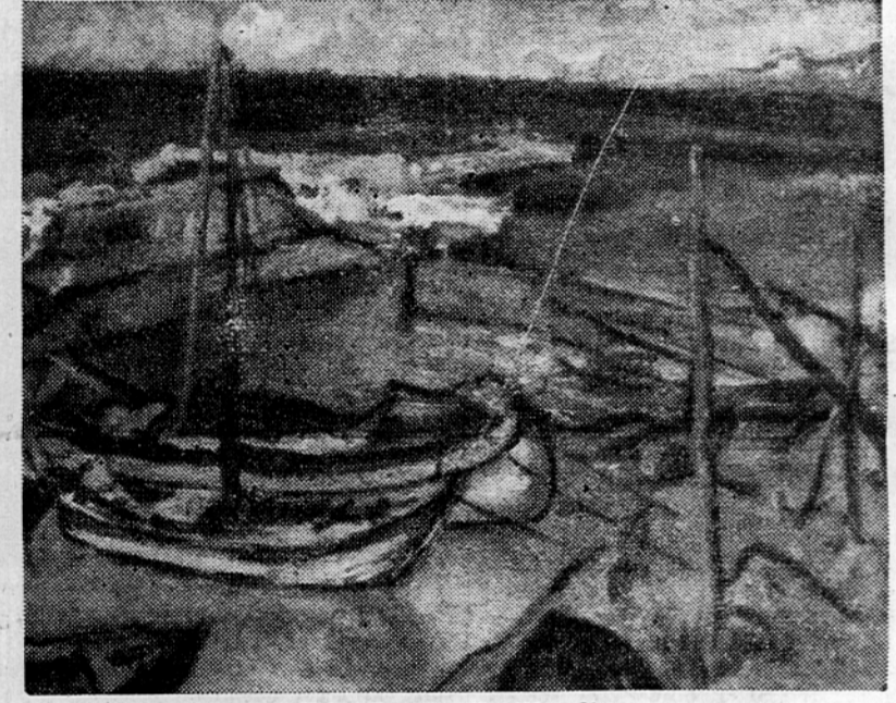
Jože Cesar: »Portič«, olje