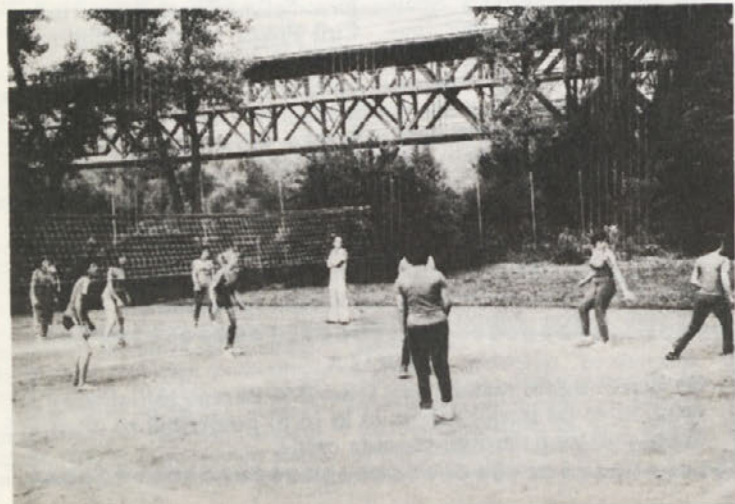
Prizor s področnega tekmovanja tekstilk v odbojki