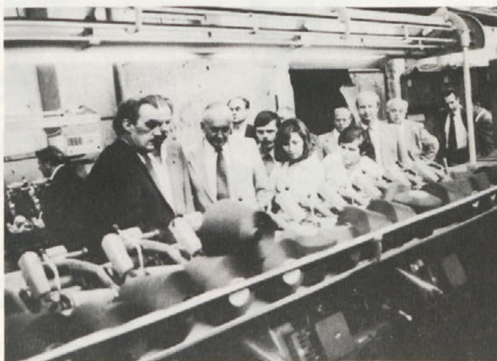
Gostje so si ogledali Novoteksovo proizvodnjo