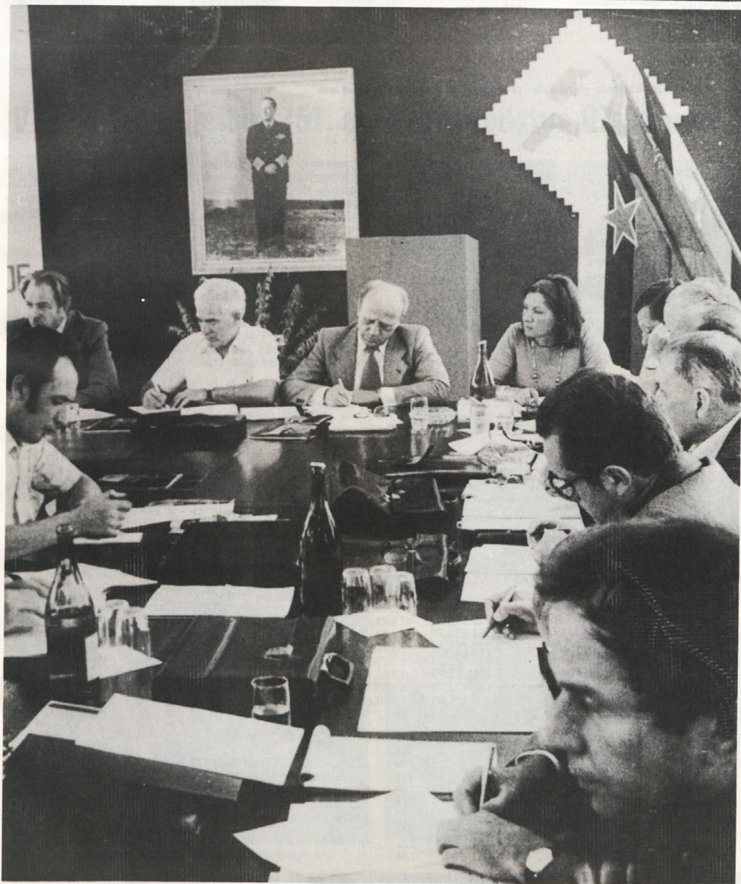
Med zasedanjem 151. seje predsedstva Gospodarske zbornice SR Slovenije, ki je bila v naši tovarni