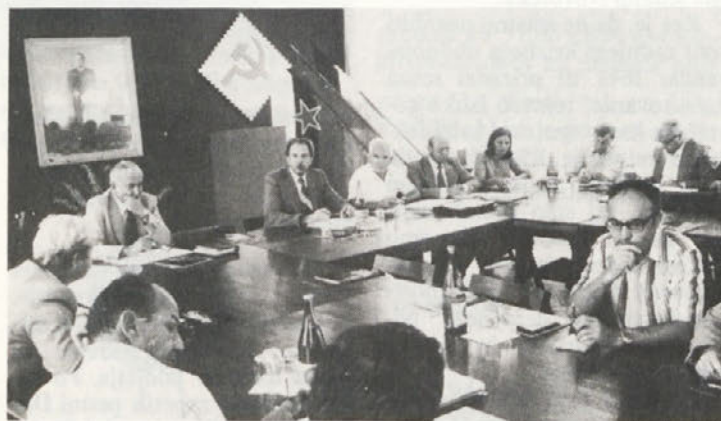
Med potekom 151. seje GZS

V srednjeročnem načrtu za obdobje 1976 – 80 pa so bila nakazana izhodišča, ki se jih bo morala tekstilna industrija temeljito držati: vsako povečanje obsega proizvodnje mora izhajati predvsem iz večje produktivnosti, zaježiti bo treba stopnjo rasti števila zaposlenih, znižati delež uvoženih surovin, povečati izvoz, izboljšati dohodkovne odnose ter povečati proizvodno in tržno elastičnost.