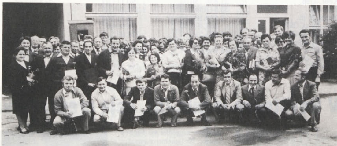
Pogled na vse letošnje jubilate

veselih in žalostnih dni v Novoteksu, časov blagostanja in kriz; v izrazu vseh pa je bila močno prisotna misel o našem skupnem boljšem življenju in boljši bodočnosti!