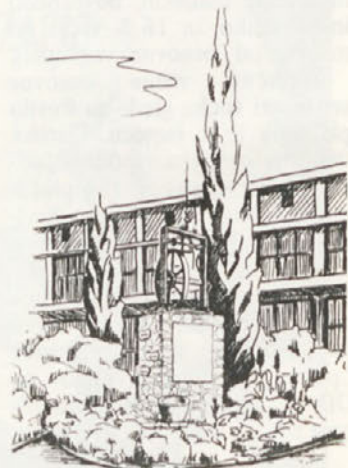
Skica spomenika, ki so ga odkrili v Ajdovščini

Te proslave se bodo udeležili tudi delegati TOZD Novoteksa ter športniki, ki so v soboto, 26. avgusta 1978 zmagali na področnem tekmovanju Dolenjske v Novem mestu.