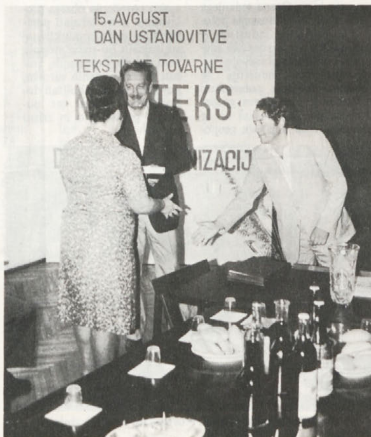
Obdaritev delavcev, ki so v podjetju 10, 20 in 30 let