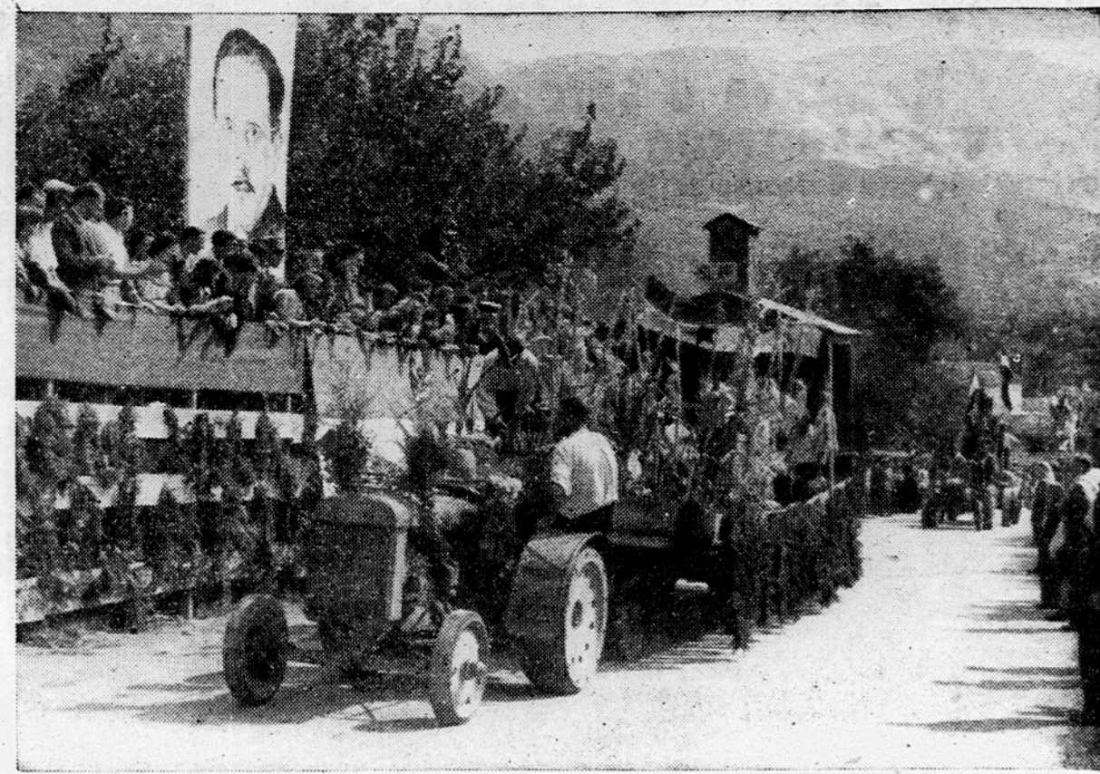
Prizor s parade dela v Ajdovščini

Ob zaključku je zasedanje sprejelo več sklepov. Okrajni ljudski odbor bo ustanovil okrajno gradbeno podjetje, za katerega so odborniki odobrili potrebni kredit. V okraju že obstoja drevnica gozdnih mladik, ki je dala doslej za penezdovanje gozdov na razpolago 40.000 mladik. Sedaj se bo ustanovila še sadna drevnica, ki bo omogočila poplenjenje sadnega drevja. V isti namen bo okrajni ljudski odbor v jeseni organiziral sadjarsko razstavo, za katero je dala pobudo Sadjarsko društvo. Odborniki so nadalje odobrili kredit za gradnjo okrajnega upravnega poslopja in za popravilo okrajne ubožnice. Poleg tega bo v prihodnjih mesecih ustanovljenih tudi več zdravstvenih postaj s posvečovalnicami za matere in več dnevnih zavetišč. Poleg teh sklepov je okrajni ljudski odbor tudi v celoti odobril okrajni proračun za leto 1948.