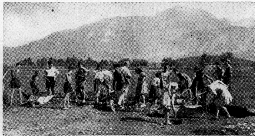
»Triglavski« mladina urejuje v Radovljici prostor za veliko fizkulturno igrišče

Julija je bila v Radovljici ustanovljena Delovna edinica mladine »Triglav«. Ta mladina si je zastavila nalogo, urediti prostor za športno igrišče, ki je za Radovljico kot letoviščarski kraj velikega tujskoprometnega pomena.