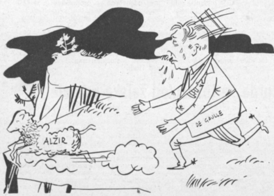
— Kam bežiš, saj nisem volk!? —