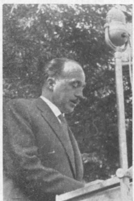
Tov. Mitja Ribičič med govorom na proslavi v Mozirju

velj. Takrat pa se je začel tudi sproščenjši del tega velikega srečanja, ko so se stari znanci ponovno srečali, ko so se pogovorili o težkih bojih, o svetlih zmagah in dolgih pohodih. V prijetnem razpoloženju, ob nenehnem obujanju spominov je mimil dan. Vzdušje, ki je ves čas vladalo med udeleženci te velike proslave, pa smo v sliki in besedi skušali vsaj skromno ujeti v reportažo na šesti strani.