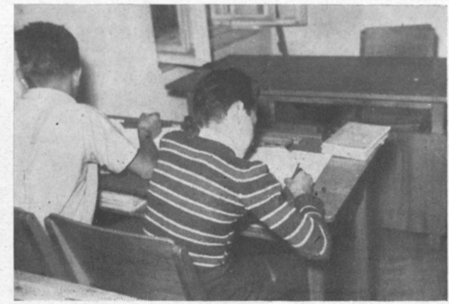
Z novim šolskim letom v reformirani šolstvo; velike skrbi velikih ter male malih ljudi...

Kot v celjskih šolah, so tudi po ostalih osemletnih šolah celjskega okraja šolski razredi prenatrpani. Kritično stanje je predvsem v Zrečah, kjer bodo primorani uvesti tretjo izmeno, če v dolednem času ne bodo rešili vprašanja pretesnih šolskih prostorov.