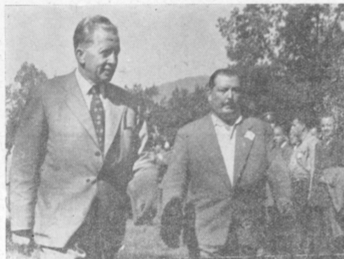
Slovesnosti v Mozirju se je udeležilo okoli 300 živčnih borcev in aktivistov SNOUB Slavka Šlandra in vseh predhodnih enot te prve štajerske udarne brigade

300 BORCEV IN AKTIVISTOV PONOVO ZBRANIH POD ZASTAVO SNOUB «SLAVKA ŠLANDRA»