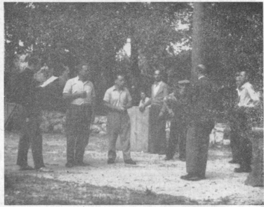
Kot vse ostale priprave na velike slovesnosti v okviru proslave »90-letnice žalskega Tabora«, je tudi delo igalskih družin pri vajah za uprizoritev »Velike puntarije« v skrajno napetem stanju. Kot v Zalcu še vse mrgoli na Grbiških cest, hmeljarskega doma in drugod, tako bo tudi v letnem gledališču v Grizah v soboto zvečer vse pripravljeno za sprejem gostov.

Tudi nastanek III. zbornika je pokazal, da je ob primernih subjektivnih in objektivnih pogojih možno in potrebno dalje razvijati publicistično dejavnost naših javnih, kulturnih in prosvetnih delavcev. Tako uredništvo kakor založnik in pokrovitelj v osebi okrajnega sveta za kulturo in prosveto vidita v svojih izdajah v prvi vrsti podobo razvoja in prizadevanj za napredek na vseh področjih družbenega življenja, torej nujno potreben kulturnozgodovinski dokument našega kraja, življenja in ljudi. S to mislijo so se že pričele priprave za izdajo zbornika 1959. Zato naj velja naša kulturnoprosvetna beležka hkrati za vabilo k sodelovanju. Posebno dobrodošli bodo predvsem tisti sestavki, ki bodo obravnavali vprašanja, ki neposredno zadevajo življenje našega človeka in kraja, ga uravnavajo na nova, naprednejša pota in mu odpirajo nova, svetlejša obzorja.