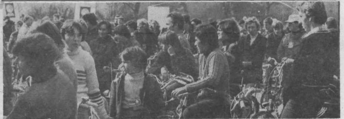
Predzadnja letošnja skupna ljubljanska trim množična akcija kolesarjenja, ki jo je organiziral koordinacijski odbor strokovnih sodelavcev občinskih telesnokulturnih skupnosti iz zvez telesnokulturnih organizacij, je privabila v športni park na Kodeljevem, kjer sta bila start in cilj, več kot 800 udeležencev. Kot je že v navadi na takih akcijah, je vsak udeleženec prejel značko in nalepko akcije, izžrebali pa so tudi dobitnike praktičnih nagrad, ki sta jih prispevala pokrovitelja akcije tovarna koles Rog in Slovenija šport. Najprivlačnejša je bila pač prva nagrada, poni kolo, zaradi katere so mnogi udeleženci akcije vztrajali do konca in upali, da bodo med srečnimi dobitniki. Gneča na sliki nazorno kaže, da je bilo udeležencev veliko, ki so na cilju čakali na žrebanje.