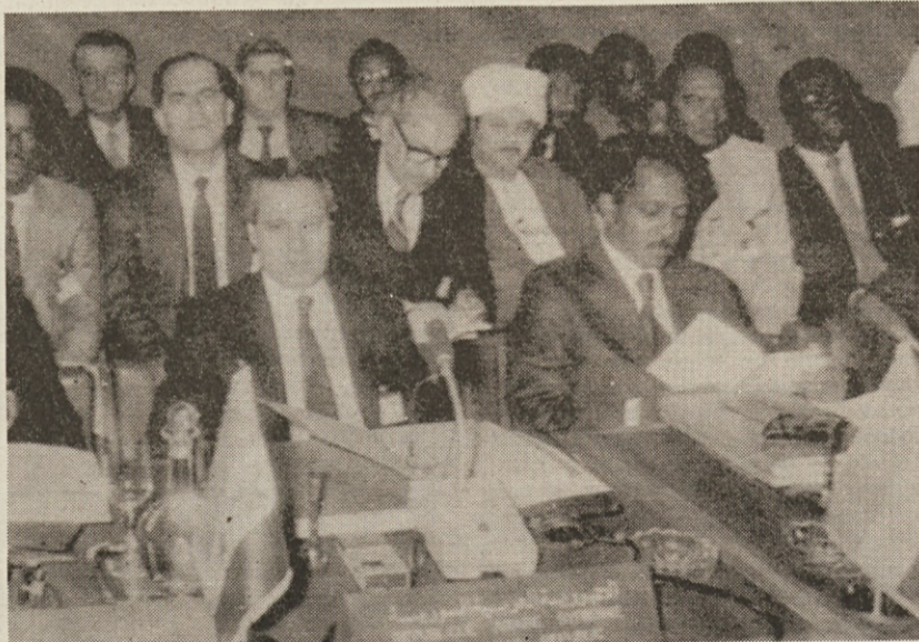
Po izrazih podpore Libiji so tretji dan islamske konference v Fesu začeli razpravljati o iransko-iraški vojni. Vsakomur pa je lahko že sedaj jasno, da bodo rezultati borni zaradi nepopustljivosti Irana