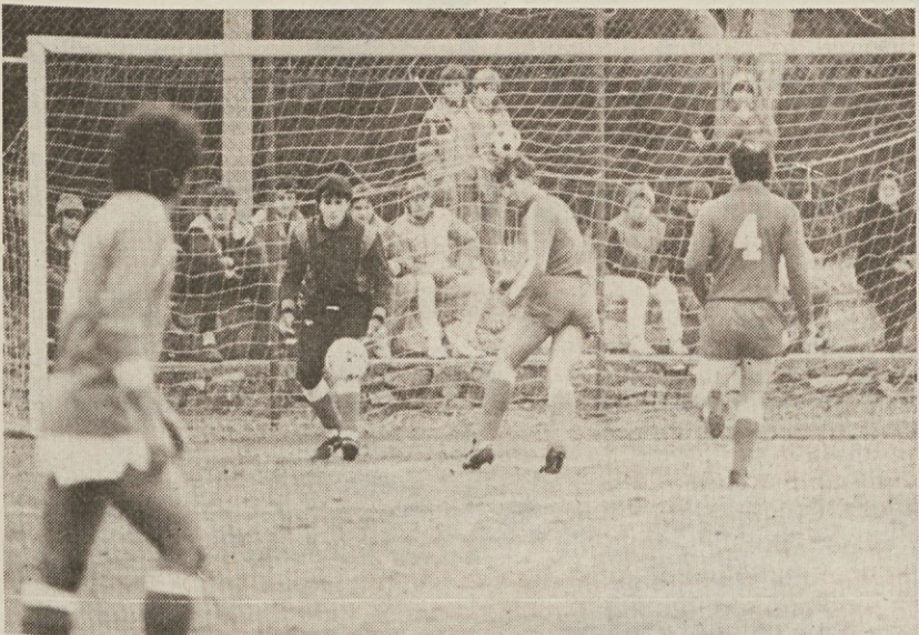
Akcija pred bazovskimi vrati med derbijem Zarja - Vesna

Božič in novoletni prazniki so mimo. Tudi za naše nogometaše v drugi amaterski ligi, ki so se v teh dneh malce odpočili. Sicer to ne velja za kriško Vesno, ki je igrala v deželnem pokalu in v nedeljo tudi premagala moštvo Ronchija z 2:1. Daljši odmor so pa imeli nogometaši bazoviške Zarje, ki so kot Križani v prvih 14 kolid 2. AL izredno uspešno igrali.