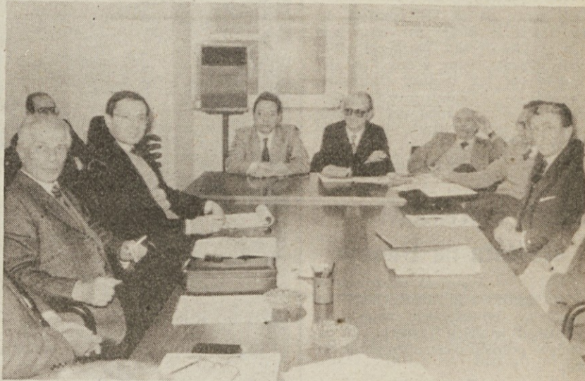
Z včerajsnjega sestanka med tajniki avtonomnih zdravniških sindikatov

Tako imenovanih javnih zdravnikov je okrog 100.000, prizadetih bolnišnic pa 1.300. Stavke, se udeležujejo tudi veterinarji in psihiatri.