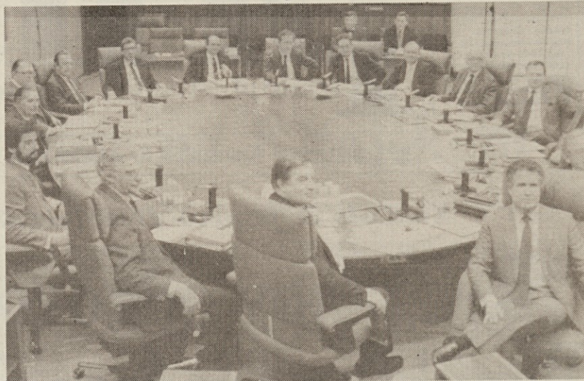
Oba predstavnika Španije in komisar Portugalske so včeraj pred komisijo EGS orisali svoje bodoče delo