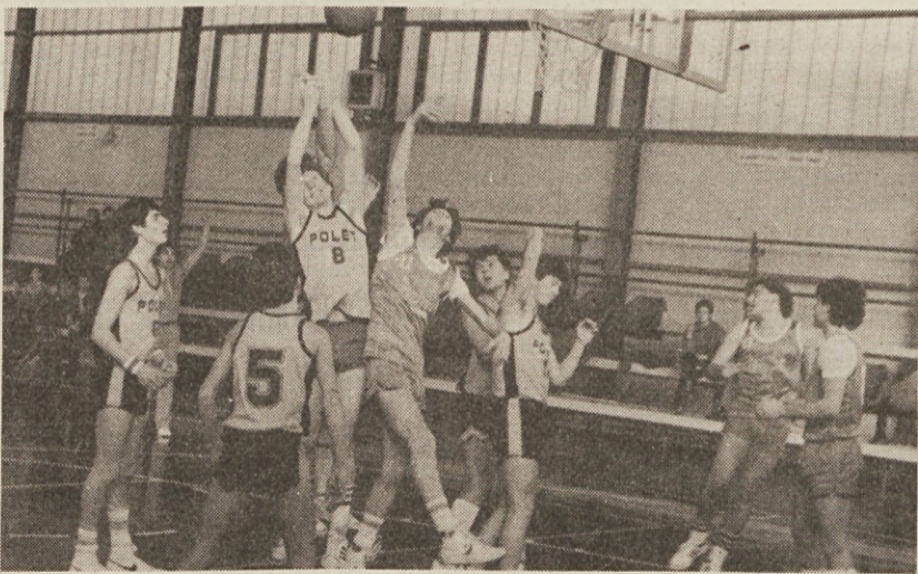
Boj pod košem na tekmi med Poletom in Domom

V naših košarkarskih krogih (in ne samo v le-teh) je precej komentarjev glede nedeljskega slovenskega mladinskega derbija v Repnu med Poletom in Domom. Redkokdaj smo bili priča, da bi morali kako naše srečanje zaradi izgredov prekiniti. To se je žal zgodilo v nedeljo v Repnu, ko je sodnik v 36. minuti prekinil tekmo in odšel v slačilnico.