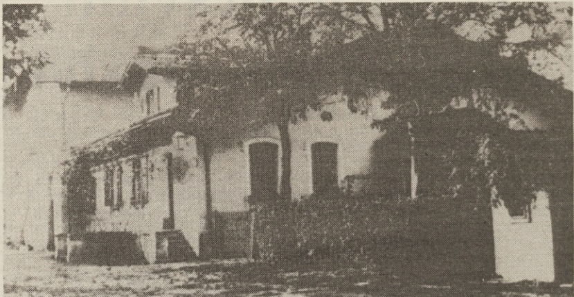
Pogled na stavbo mestnega podjetja za plin ob koncu 19. stoletja