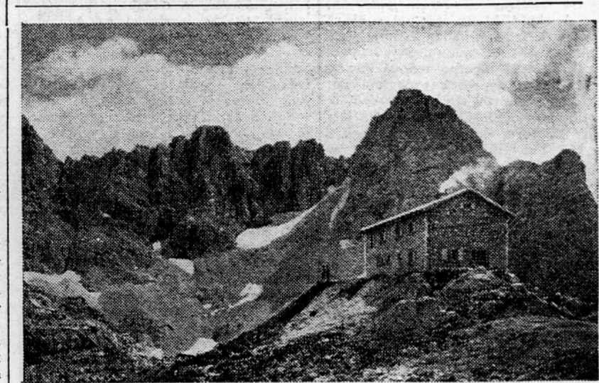
Novi Radovljiški dom pri Krizkih jezerih