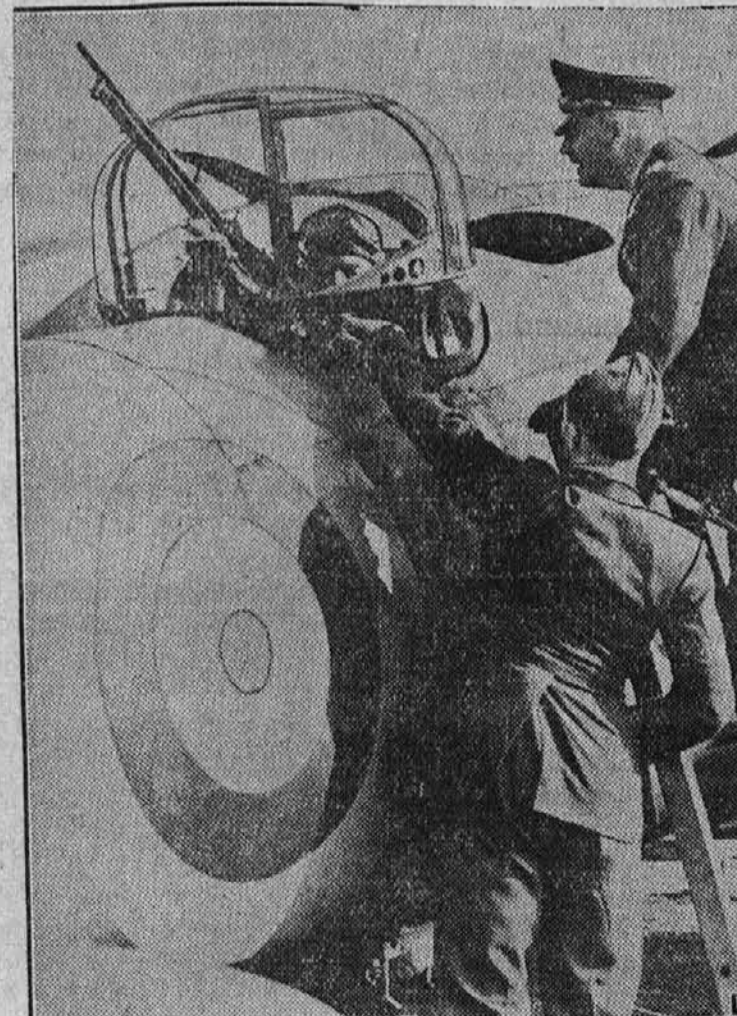
Nemški častniki si ogledujejo angleški zrakoplov, ki ga rabijo za metanje bomb. Ali Angleži to razkazujejo Nemcem zato, da bi jim ulili strah v srce?