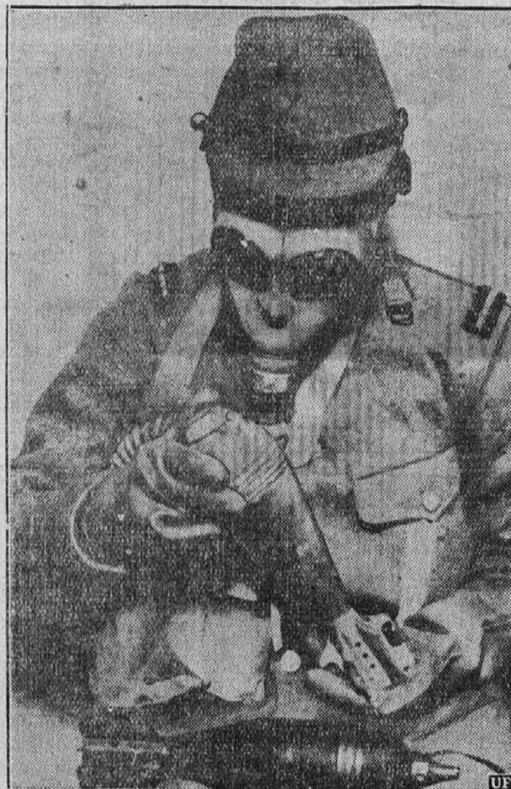
Japonski častnik preiskuje kroglo, ki je napolnjena s kemikalijami in ki so jo našli v zavzetih kitajskih strelskih jarkih. Japonci se hočejo prepričati, če se Kitajci poslužujejo kakih "protipostavnih" kemikalij.

Vsako, ki pošlje denar v stari kraj dobi pri Kollanderju krasen stenski koledar zastoj.