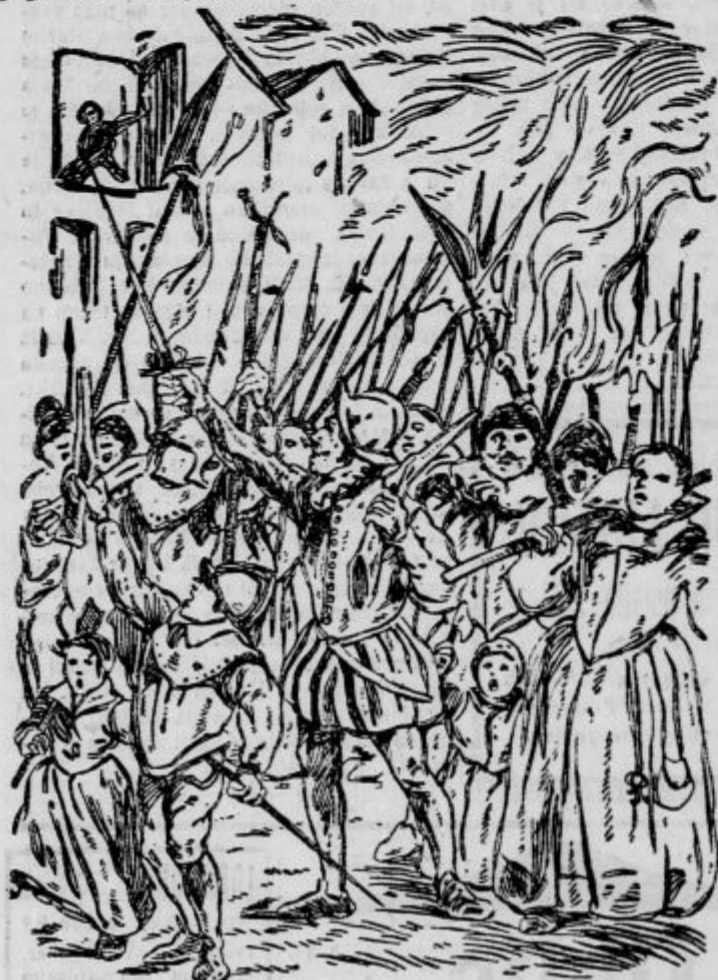
V ulici Arbree Sec je bila buka najglasnejša. Ulica je bila dobesedno natrpana, in množica se je prerivala v smeri proti neki goreči svetiljki, ob koje svitu si mogel razbrati napis nad nekimi

Pariz je zvečer bil en sam velik tabor. Povsodi stiska ljudi in gneča, razburjenje, divje pretnje proti Huguenotom ali roganje na njihov račun. Kjer so bili razpoloženi zapisniki za vpisovanje v Ligo, je bila gneča največja, krik najbolj oglušen. Klerikalizem je prvič v Franciji javno nastopil.