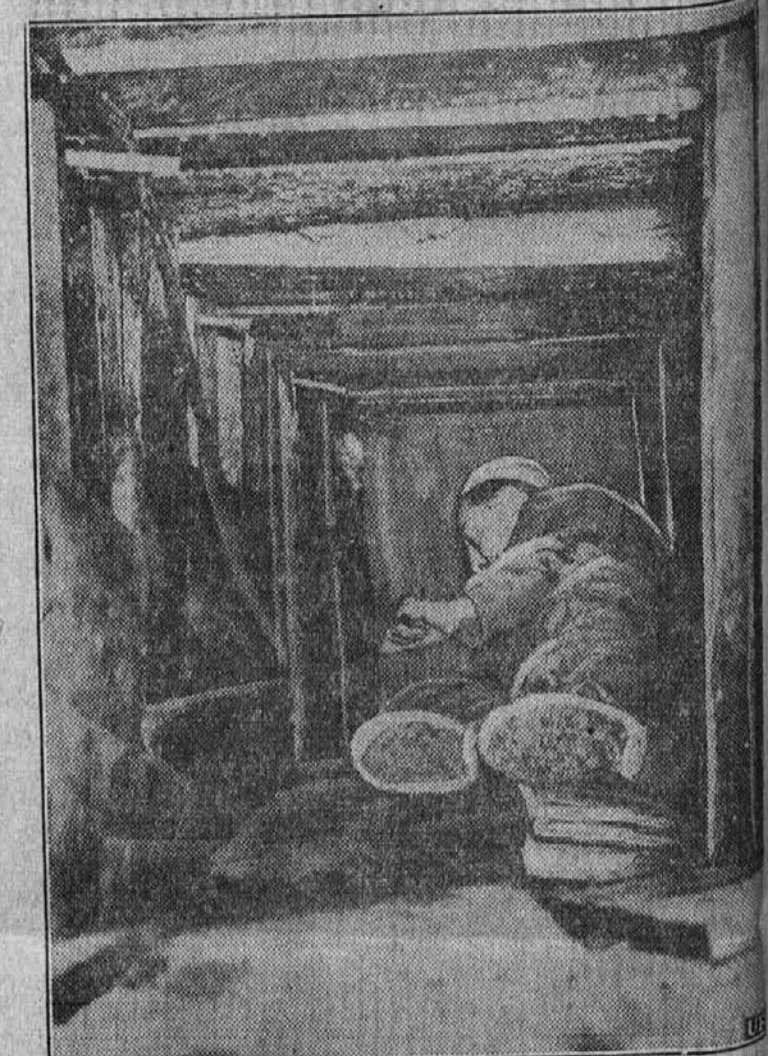
V državni jetnišnici v Philadelphiji so bili jetniki izgorjeni pod obzidjem 50 čevljev dolg predon, ki ga vidite na sliki. Pazniki so predor odkrili, predno so mogli jetniške pobegniti.