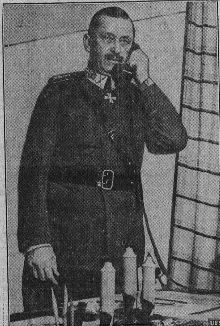
Baron Mannerheim, poveljnik finske armade. Približno je kot eden najboljših vojskovodij na svetu.