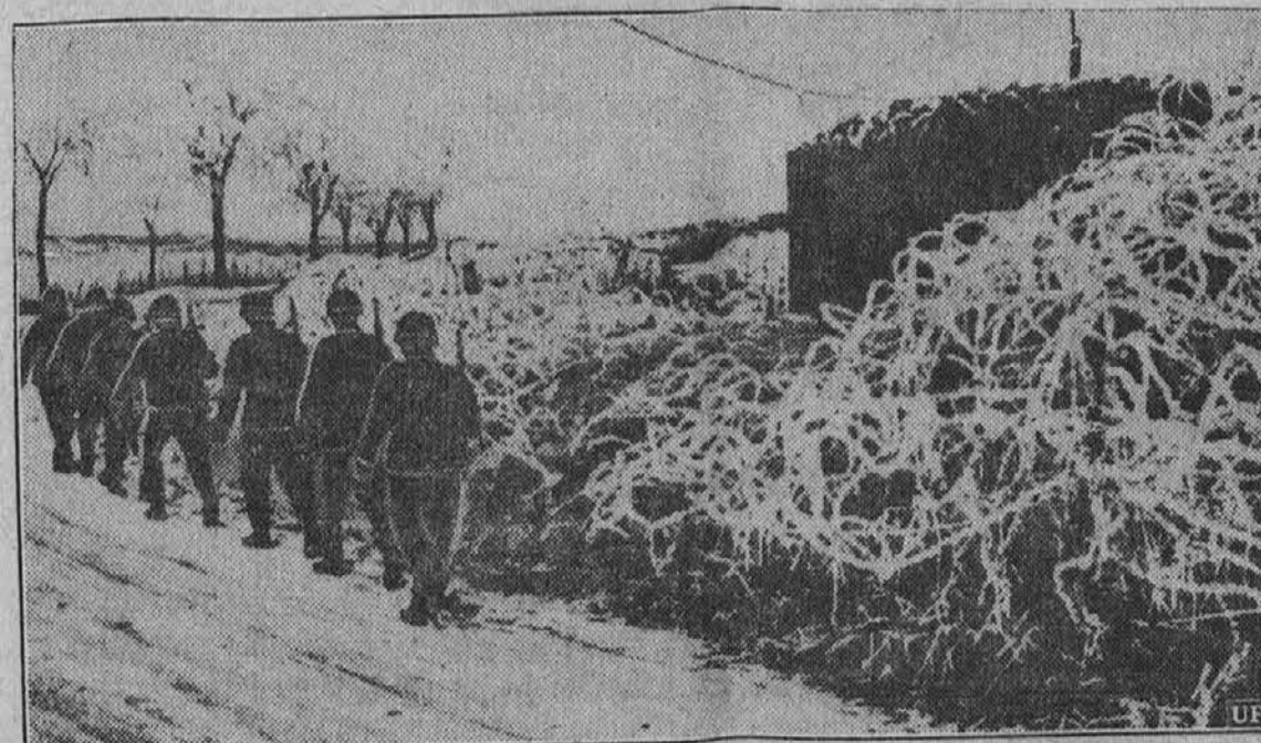
Ne samo po gorah je vojna, ampak tudi na zapadni fronti. Oddelek nemških vojakov gre v pozicije, da izmenjajo druge.