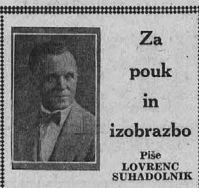
Članek 23 DOBER NASVET