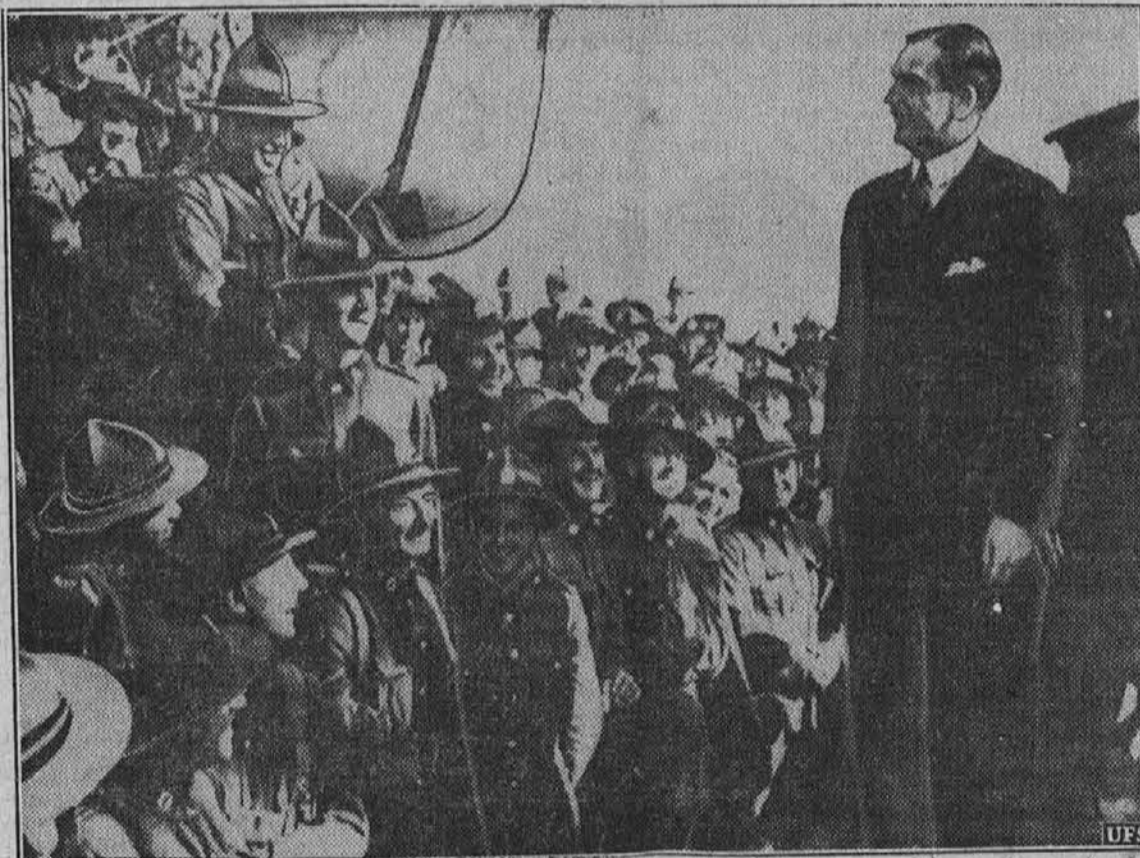
Tajnik angleških Dominionov, Anthony Eden, ki je v Egiptu pozdravil čete iz Avstralije in Nove Zelandije, ki so prišli na pomoč Angliji.

Išče se dobro gospodinjo, ki mora biti tudi dobra kuharica in dobra katičanka, stara od 45 do 50 let. Mora znati tudi angleško. Za naslov se poizve v uradu tega lista. (55)