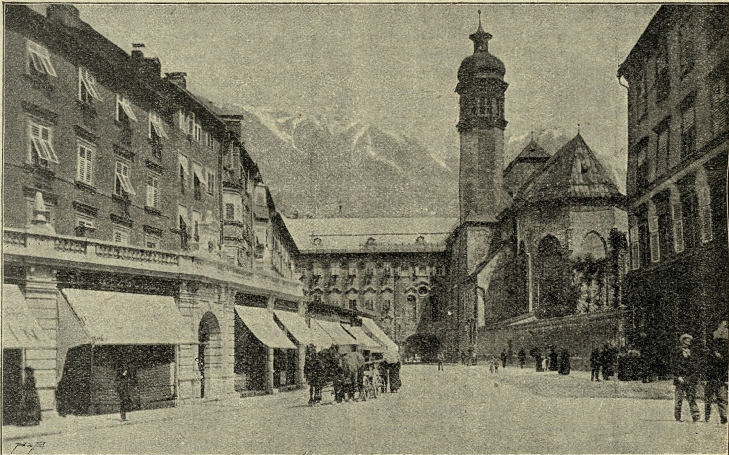
Der Burggraben mit Hofkirche in Innsbruck. (Text siehe Seite 275.)

Ein Missionspriester fuhr einst in Indien nach Delhi in Gesellschaft eines Soldaten, der ein eingeborener heidnischer Indier war. Sie unterhielten sich sehr gut miteinander und sprachen von Militärwesen und von religiösen Sitten und Gebräuchen. Der Soldat zeigte sich auf all diesen Gebieten sehr bewandert und sprach sich mit der größten Offenherzigkeit aus. Der Missionär bot demselben, nachdem sie einige Stunden miteinander gefahren waren, Brot und Bananen an, die er mit großer Artigkeit annahm, ebenso wenig verschmähte er einige Stück Zigarren, die ihm präsentiert wurden. Allein