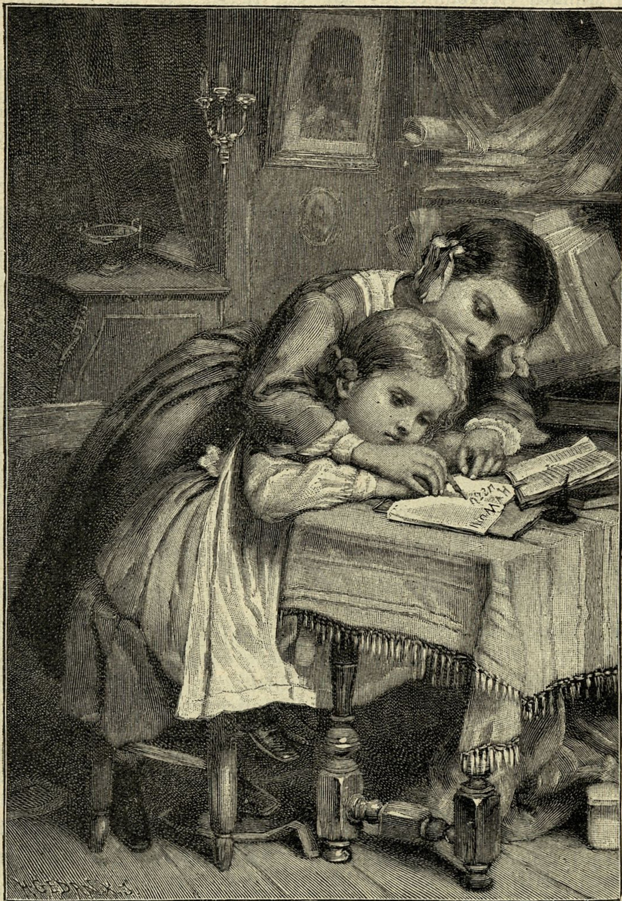
Die ersten Schreibübungen.

ren war. Der Vorgesetzte kommandierte jedoch in einem Atemzuge fort, bald so, bald anders, ohne aber selbst Hand anzulegen. Da fragte der Offizier den gestrengen Befehlshaber, warum er den Soldaten nicht helfe, den schweren Balken an den Ort seiner Bestimmung zu lüpfen, da er ja sehe, daß die geringe Mannschaft es nicht bemeistern könne? Über diese erniedrigende Zumutung höchlich erbittert, warf sich der Kommandant womöglich noch mehr in die Brust und sprach mit Sultansmiene: „Herr, ich bin ein Korporal!“ — „Ach wirklich?“ entgegnete hie-