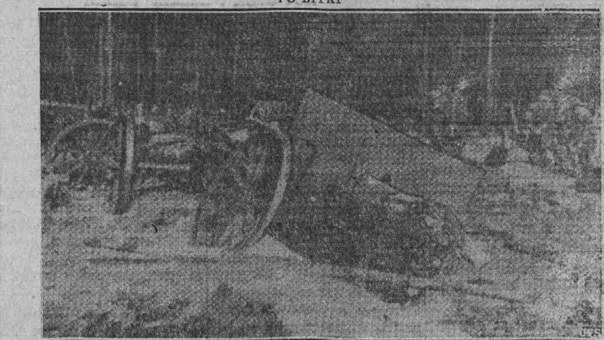
Gornja slika, ki je prišla iz Berlina, kaže prizor, kakoršnih se je zadnji mesec dosti videlo po Poljski. Med tem časom pa so nazivi uspešno "pomirili" Poljake in si "varstvo" nad njimi razdelili z Rusijo.

Telečji zrezki po francosko Potrebujes tri telečje zrezke, eno jajce, drobtine, eno čebulo, pol funta gobic in tri rezin nepretrdega sira. Zrezke povaljšaj v jajcu in