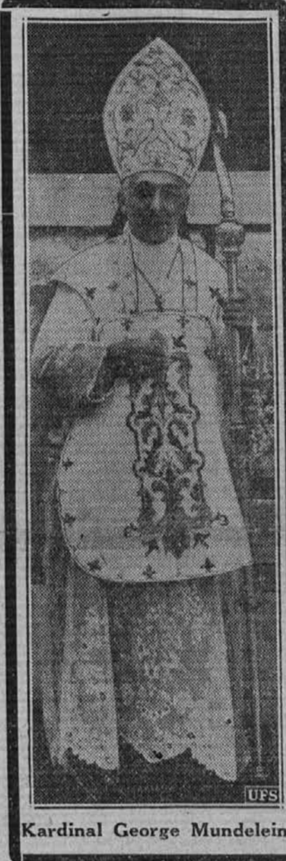
Kardinal George Mundelein

Berlin, Nemčija. — Kot posledica nove zveze s komunistično Rusijo so v Nemčiji prepovedane vse protikomunistične aktivnosti. Tako se ne sme več tiskati te vrste literatura in tudi razne protiboljševiške organizacije so morale prenehati s poslovanjem. Toda istočasno pa se tudi ne bodo dopustile v Nemčiji komunistične aktivnosti in Stalinova slika ne bo smela biti razobešena v privatnih domovih.