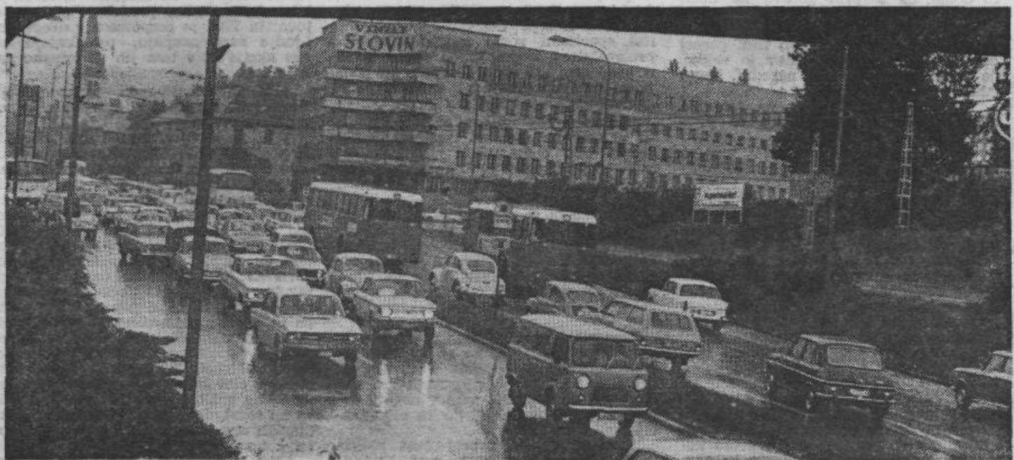
Kako na Gorenjsko? Jasno, skozi center!