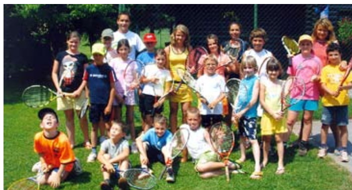
Skupinska slika – prvi termin

Naše druženje je potekalo od ponedeljka do petka, od 8. oziroma 9. do 15. ure. Dopoldanski čas je bil, kot je že v navadi, namenjen teniški tečaju – otroci so se na teniških igriščih urili vsak dan tri šolske ure, seveda s krajšimi odmori za ohladitev in potešitev žeje. Razdeljeni so bili v skupine glede na starost in predznanje, tako da je bilo učenje bolj optimalno. Po teniškem delu je sledilo odlično kosilo, popoldan pa smo se spoznavali še z badmintonom, odbojko na mivki in kdaj zavili tudi na nogometno igrišče. Po napornem športnem udejstvovanju smo se na koncu sproščali ob igranju kart in balinčkanju, najbolj vztrajni pa so se še enkrat podali na teniška igrišča. Zadnji dan tečaja je bil na programu turnir, ki so ga otroci ves teden z nestrpnostjo pričakovali. Morali so namreč pokazati, česa so se v enem tednu naučili. Najboljši so za svoje dosežke