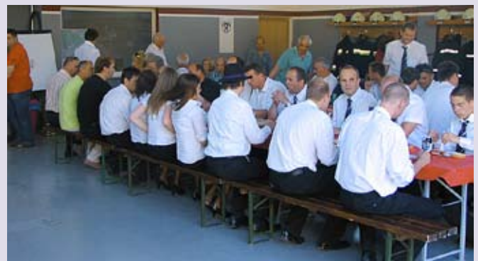
Pogostitev v gasilsko-kulturnem domu