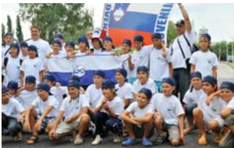
Zbrani pod slovensko zastavo.