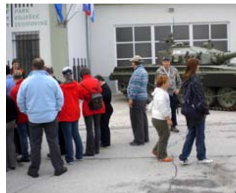
V muzeju vojaške zgodovine Pivka