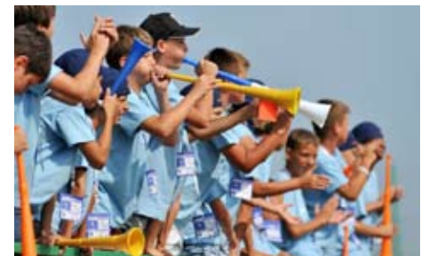
Vuvuzele tudi pri mengeških navijačih