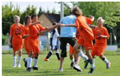
Neizmerno veselje ob zmagi.