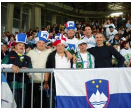
Kdor ne skače ni ... Mengšan.