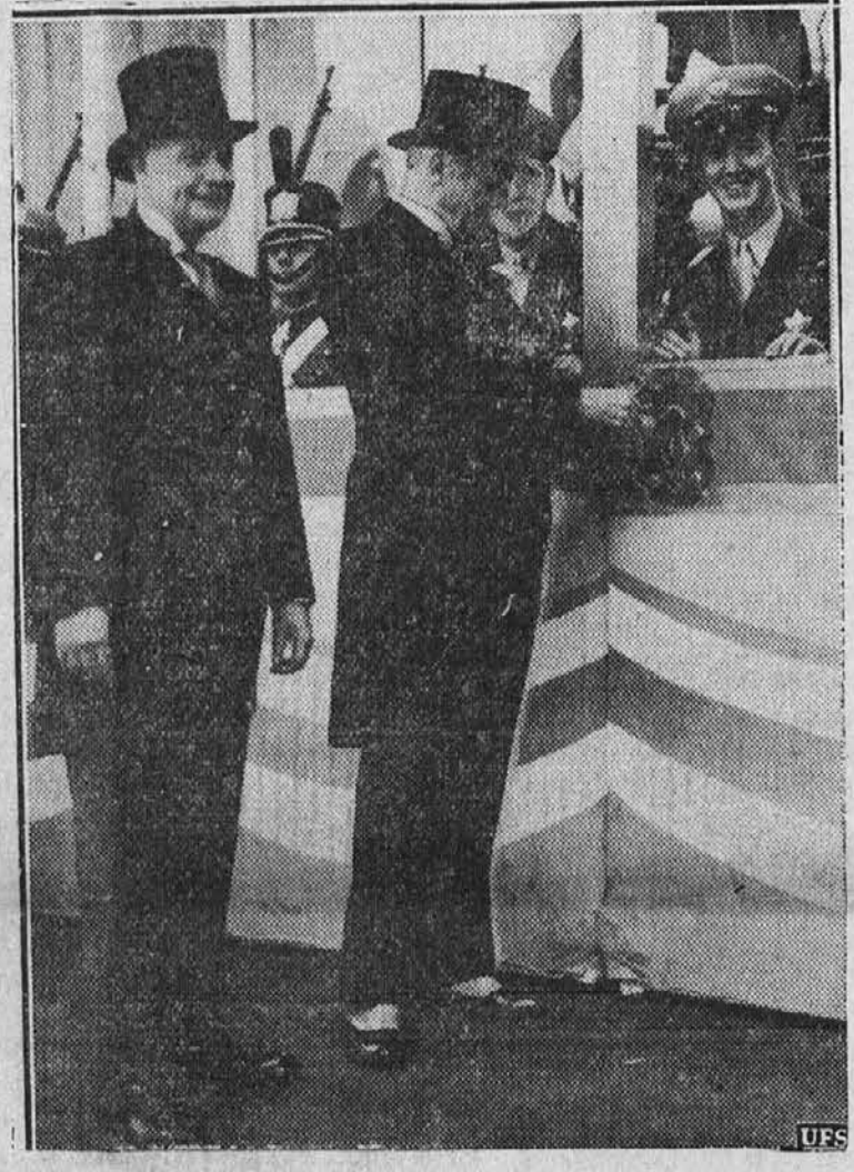
Kalifornijski governer Olson je odprl razstavo v San Franciscu z zlatim ključem, ki je veljal $38,000.00. Prvi dan je obiskalo razstavo 138,000 oseb.