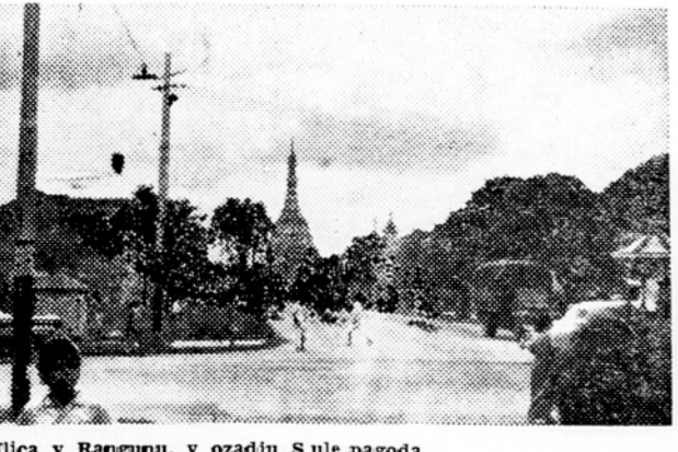
Ulica v Rangunu, v ozadju Sule pagoda