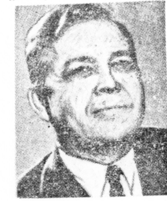
Dr. Luther Evans, predsednik UNESCO, prej direktor kongresne biblioteke v Washingtonu

V času svojega bivanja v Londonu se je Markezinis sestel z britanskim ministrom za trgovino Thorneycroftom. Kakor izjavljajo, Markezinis tu ni imel razgovorov glede britanskega posojila Grčiji, vendar pa je v stiku s številnimi bančniki in trgovskimi osebnostmi razložil načrt novega grškega zakona, ki daje pobudo tujim kapitalistom za investicije v Grčiji.