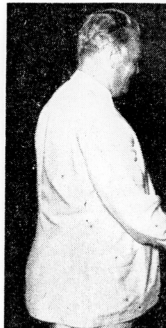
Predsednik republike maršal Tito je 14. julija sprejel na Brionih voditelja »Gibanja italijanskih delavcev« Valda Magnanija, ki je na privatnem obisku v Jugoslaviji

London, 18. julija (Tanjug). Predsednik nacionalne zveze Liberije in Kameruna Azikije in drugi nigerijski politični voditelji so objavili, da pridejo v London na razgovore o nigerijski ustavi. Kakor je znano, so nigerijski politični voditelji prej odklanjali to povabilo ter izjavljali, da ne vidijo nobenih vzrokov za take razgovore v Londonu. Pri teh razgovorih namravajo ugotoviti, kaj je potreba popraviti v nigerijski ustavi. Konferenca v Londonu se bo pričela 29. julija.