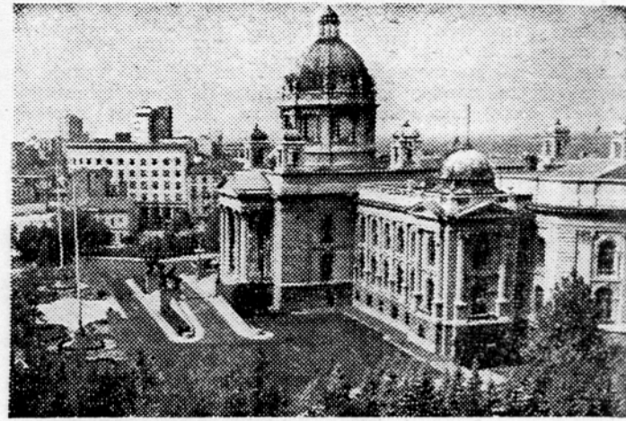
Palaca Ljudske skupštine FL RJ