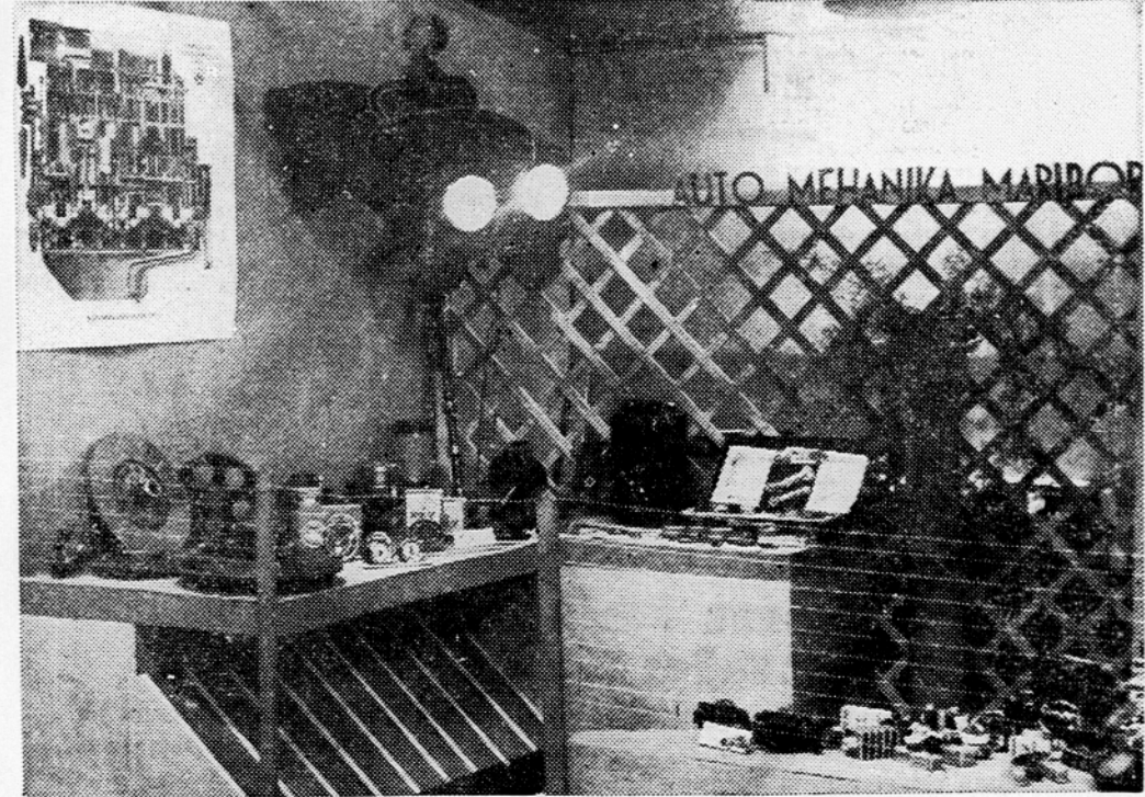
Na »Mariborskem tednu« ima tudi »Avtomehanika« svoj paviljon, v katerem razstavlja najrazličnejši avtomaterial, ki ga zainteresirani lahko nabavijo v trgovinji »Avtomehanike« v Mariboru na Partizanski cesti št. 6