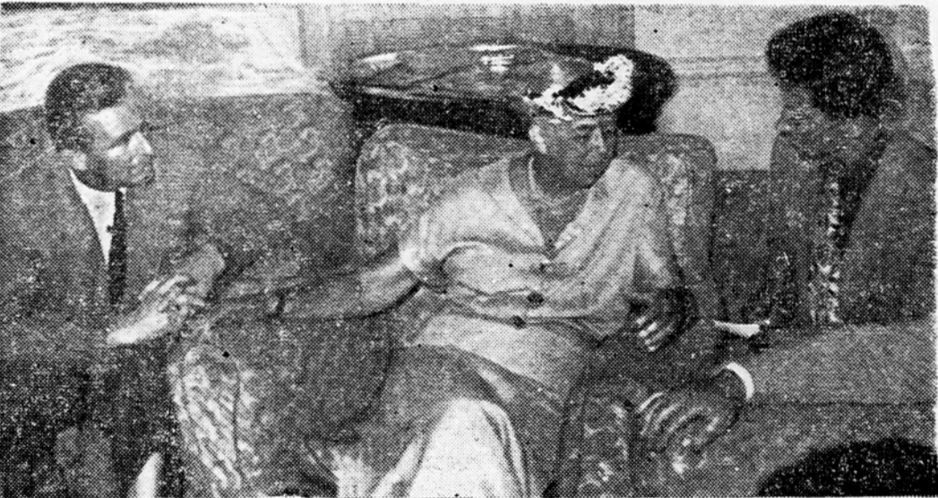
Gospa Roosevelt v razgovoru z dopisnikom »Slovenskega poročevalca« in predsednikom ljudskega odbora v Opatiji

zelo spominjate na moj narod.« »Na vašo deželo so obrnjeni pogledi vsega človeštva,« je rekla ga. Roosevelt, »zlasti zato, ker je vaša dežela med železno zavos in zahodnim svetom. Vi ste spet »ante muros« (pred zidovi), kakor nekoč v zgodovini, ko ste stali pred Turki. Vi sve svetu pokazali toliko novega in od Jugoslovancov se vsi