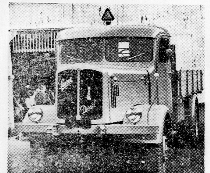
Tovarni orjak iz »Saurer Werke«, Wien, čigar zastemstvo za Slovenijo ima »Avtomehanika« v Mariboru

mi. Načrti kažejo, da bo to obširnejša moderna gradnja blizu Tomšičevega drevoreca, kjer bodo poleg drugih objektov delavnice in garaže za kakih 30 do 40 avtomobilov. Vprašanje takšnega »Avto-hotela« se v Mariboru vleče že leta in leta. Cim bolj narašča v Mariboru doma in tu turizem, tem bolj pereče postaja to vprašanje, saj že številke povedo, da dnevno išče v Mariboru 10 do 15 avtomobilistov streho za svoje avtomobile. Proračun za to sodobno in potrebno pridobitev v Mariboru znaša nekaj nad 50 milijonov din. Ne samo pri avtomobilistih, ampak tudi v tujsko-prometnem oziru si bo za to delo »Avtomehanika« zaslužila vse priznanje.