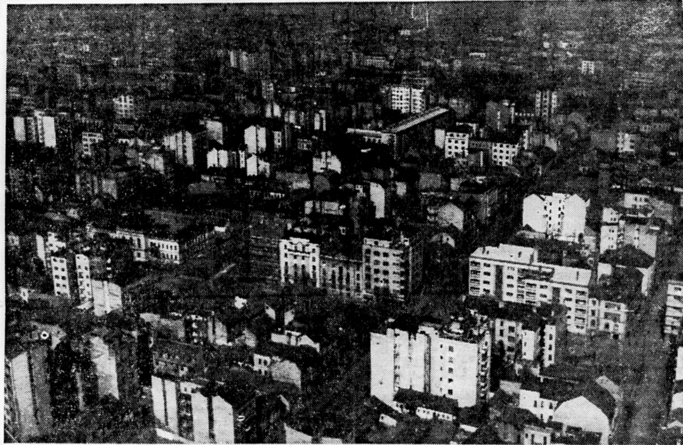
Pogled z letala na Beograd

V Beogradu je 460 gostinskih podjetij, med temi tudi 21 slaščičarn, bifejev, krčem in javnih kuhinj je 267. Hotelov in gostiln s prenočišči je 14 s skupno 1343 posteljami. Skupni promet gostinskih podjetij je lani znesel 2.994.288.000 dinarjev. Od tega so Beograjčani izdali za alkoholne pijače 1.532.546.000 dinarjev.