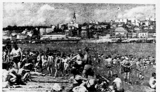
Na enem izmed mnogih beograjskih kopališč

Vzklil je že v predzgodovinski dobi, nudi v bronasti dobi svojim gospodarjem ob vnožju Avale dragoceno bakreno in svineceno rudo ter je v 4. in 3. stoletju po starem šteju postal Keltompomembna obrambna trdnjava. Kelti so izbrili domni. anti položaj Kalemegdana ter zgradili močno in odprno mesto Singidunum. Od tistih časov je v svojem 23-stoletnem obstoju premenjal mnogo gospodarjev in osvajačev, skupaj z njimi pa tudi imena: Singidunum, Singidun, Alba Greca, Alba Burgarorum, Vitenburg, Griechisch Vitenburg, Weitzenburg, Nan. dor Fehervar, Landor Fehervar so bila njegova imena, dokler ni naposled dobil ter kljub vsem navalom in osvajanjem do konca ohranil starosrbsko ime Bjelgrad in novosrbsko ime Beograd.