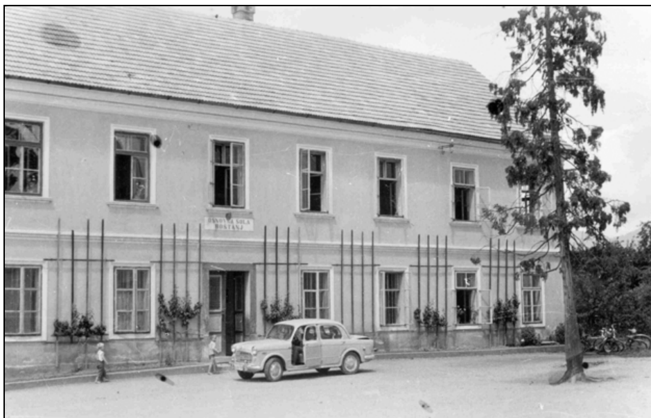
Šola v Boštanju iz časov, ko je pritegnila pozornost širše slovenske pedagoške srenje (A SŠM, fototeka)

da je šlo pri vodilnih v Boštanju za dobršno mero užaljenosti, saj naj bi izhajali iz načela, da "gre za obrambo časti Boštanja", na sodišču in tožilstvu pa naj bi razlagali "nemogoče teorije". 65