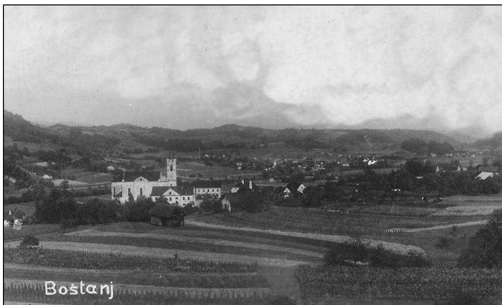
Idilična vas Boštanj na posnetku iz leta 1934. Običajno vedno nekje na obrobju, toda leta 1953 je pritegnila pozornost vse Slovenije. Nato pa se je znova potegnila v svojo zaspano idilo.