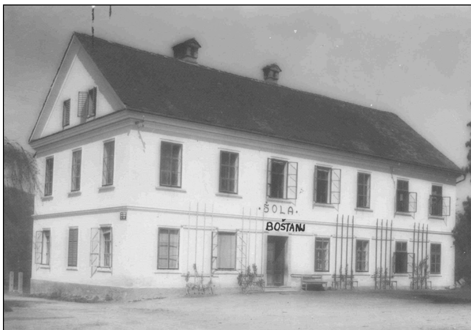
Šola v Boštanju sredi 20. stoletja