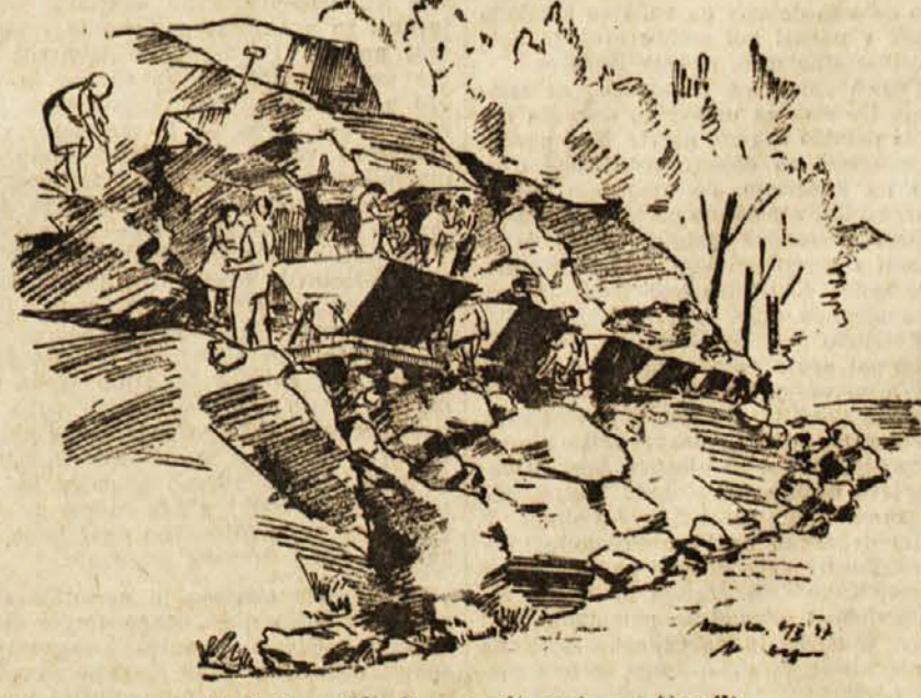
M. Lebez: Mladina gradi usek pri Nemili

ga luč v obeh brigadirjev in brigadirj, ki stoje v špalirju na nasipu. Že dva, tri dni so z nestrpnostjo čakali na ta trenutek, govorili so o njem in se ga veselili.