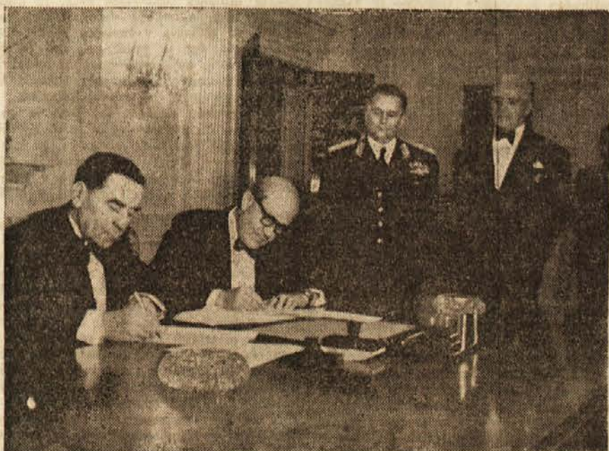
Podpisovanje protokola o kulturni konvenciji med Jugoslavijo in Rumunijo. Konvencijo so podpisali v prisotnosti maršala Tita in Petru Groze — Stanoje Šimič in George Tatarescu

To so nepopolni podatki o odpeljanim materialu, ker so iz Pulja odpeljali še mnogo več strojev, materiala in delov raznih industrijskih naprav. Pri vseh teh odvajanjih je aktivno sodelovala civilna policija in preprečila dostop delavcem, za prevoz pa so uporabljali celo angleške kamione in ladje.